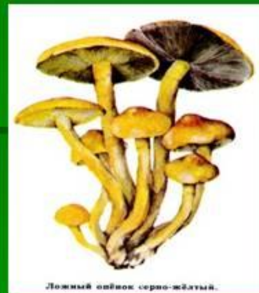
Ложный опенок серно-желтый.