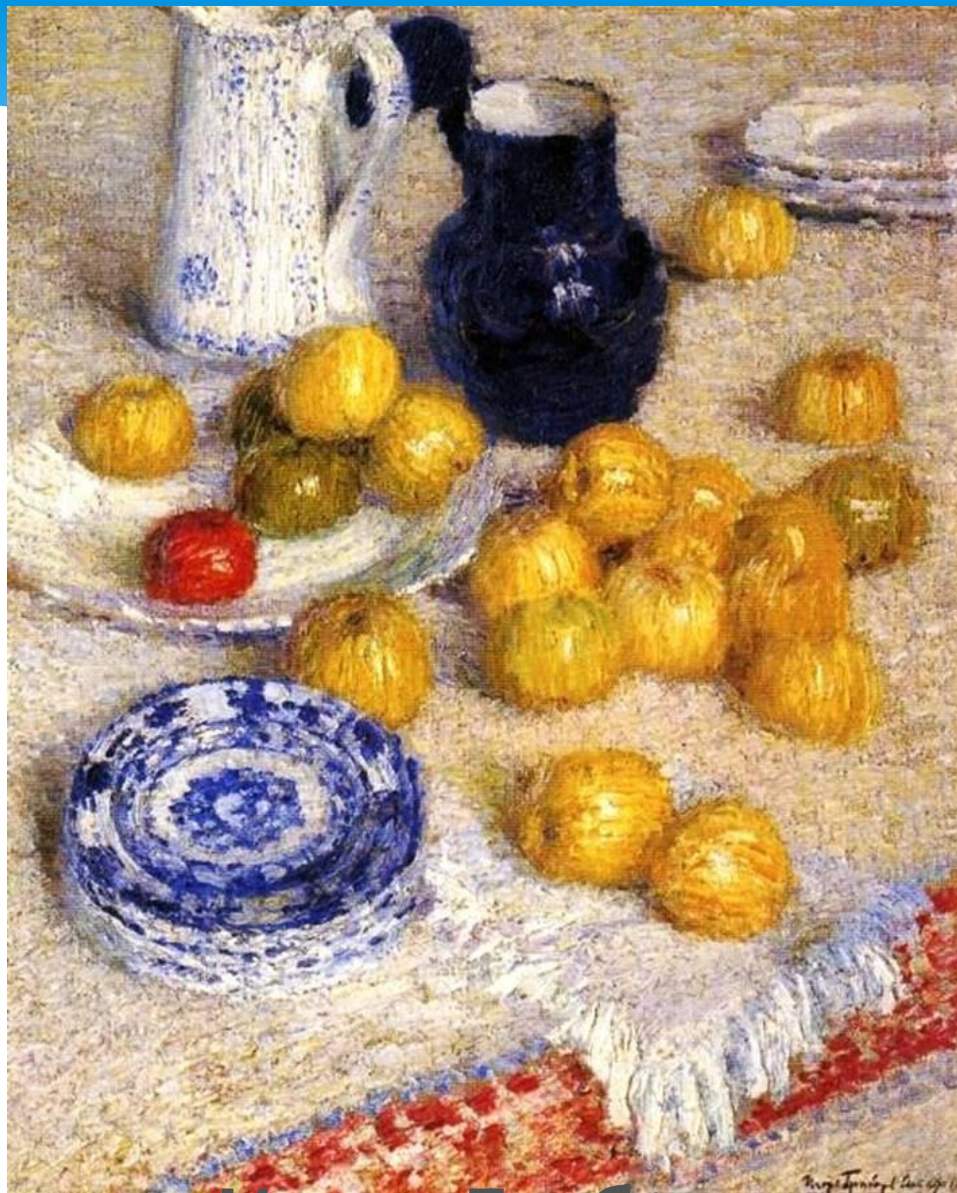
Игорь Грабарь. Яблоки.