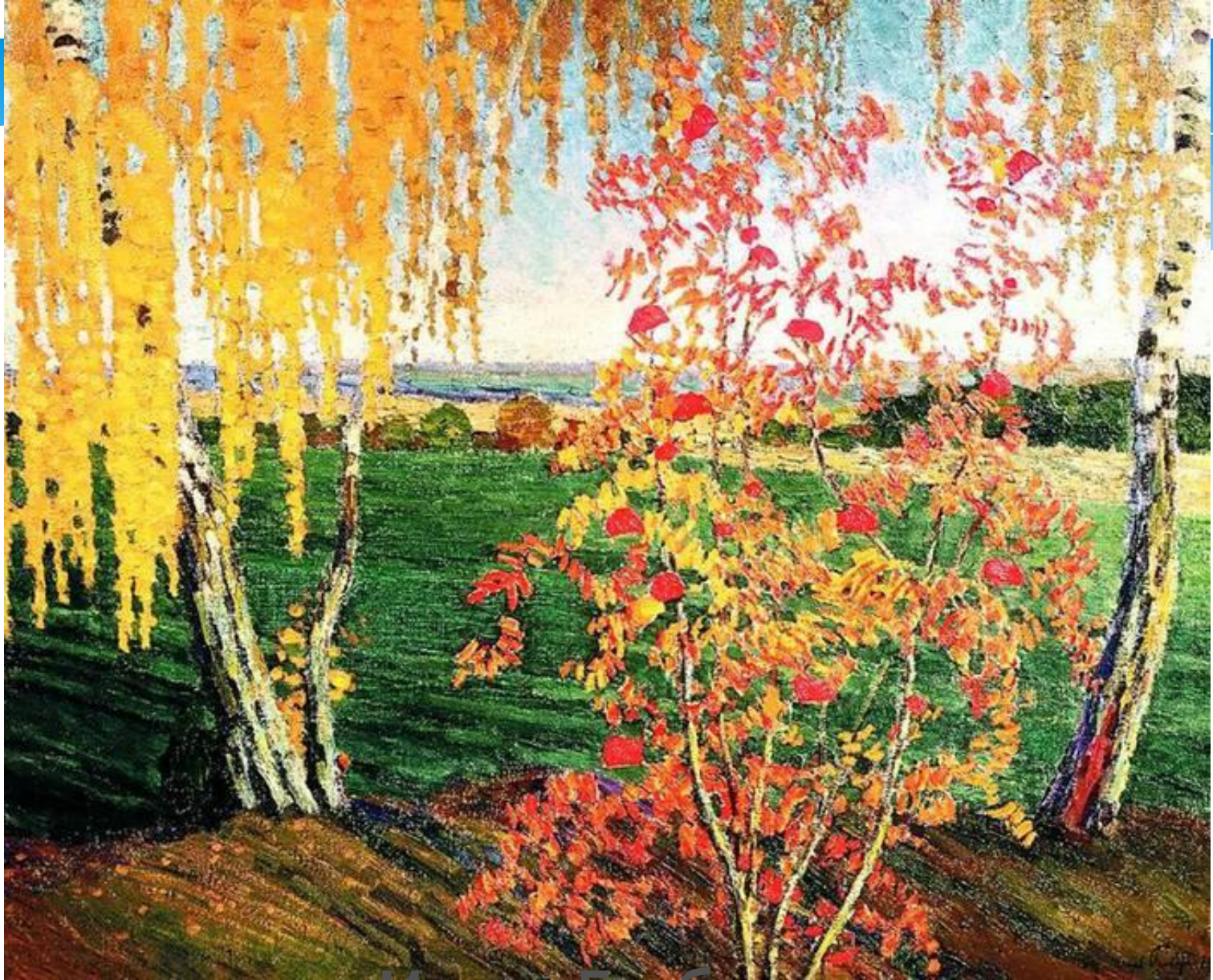
Игорь Грабарь. Осень. Рябина и берёза.