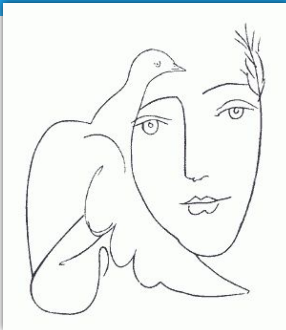
Пабло Пикассо. Голубь мира.