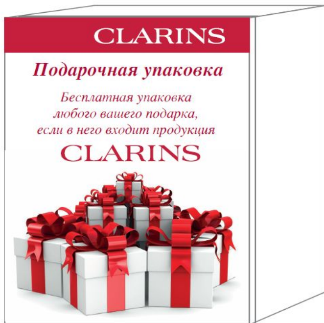
ВНЕШНЯЯ СТОРОНА вариант 7