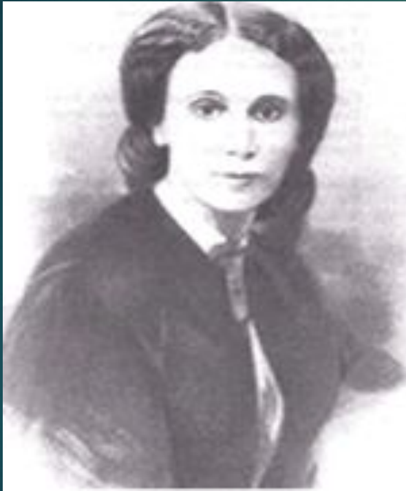
Последняя любовь поэта. Фотография 1860-е гг.