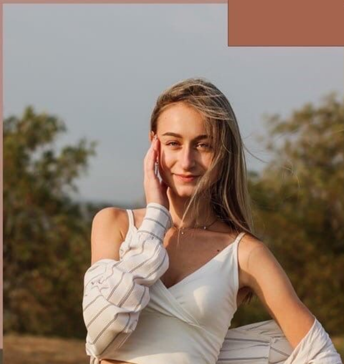
Ученица 10 класса