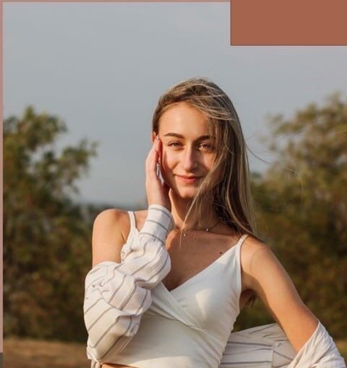
Ученица 10 класса