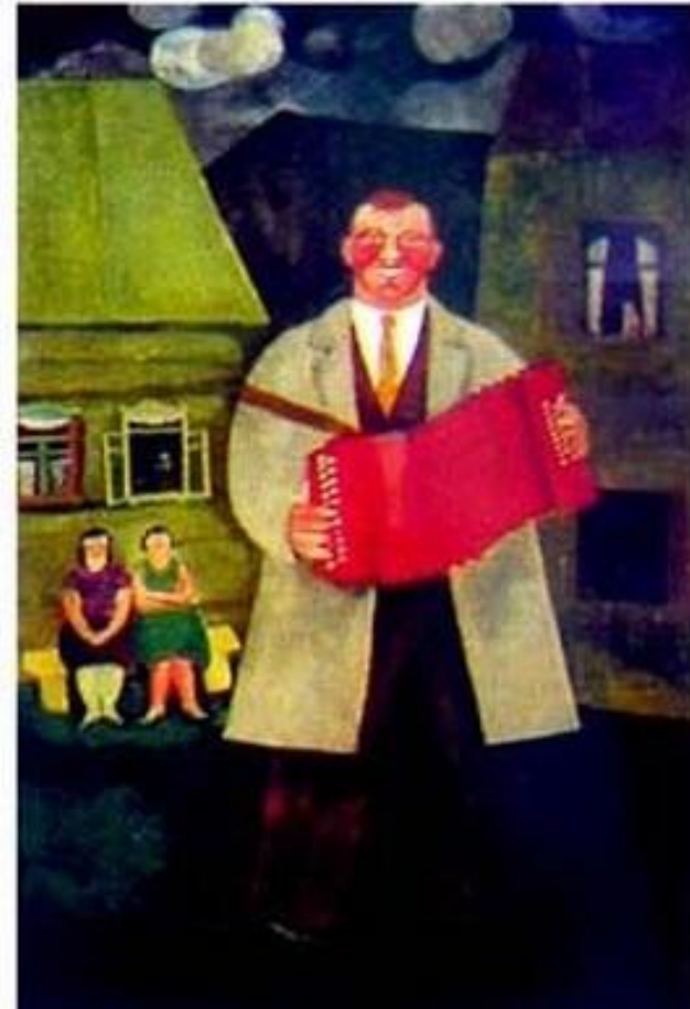
Солнце село за бугор. триптих. 1966