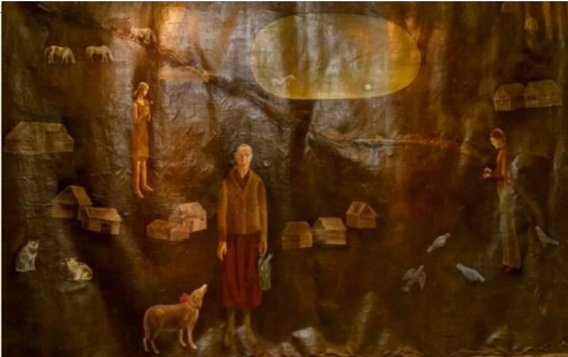
◦ Памяти Виктора Попкова (Милая сердцу земля Виктора Попкова).1974