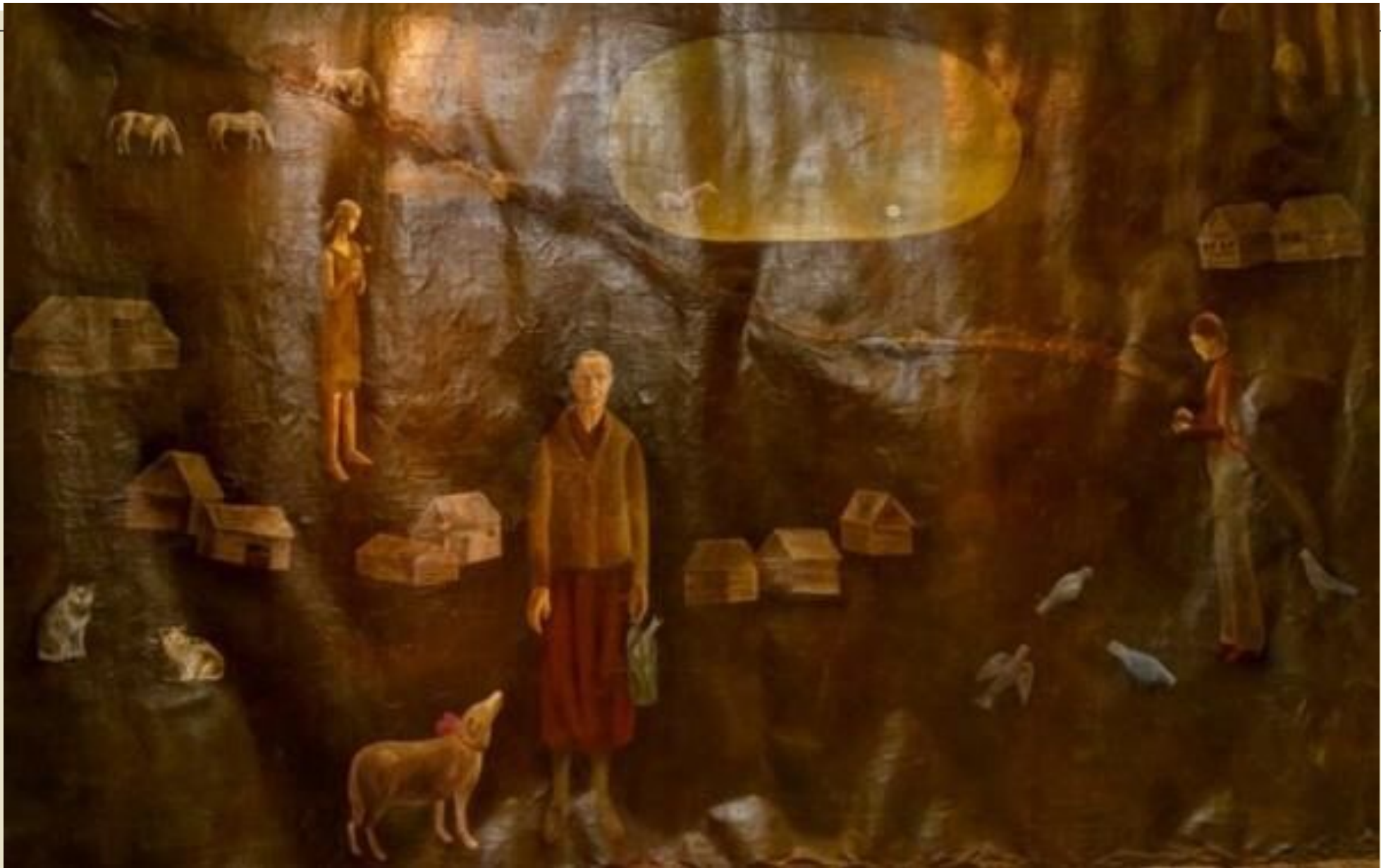
◦ Памяти Виктора Попкова (Милая сердцу земля Виктора Попкова).1974