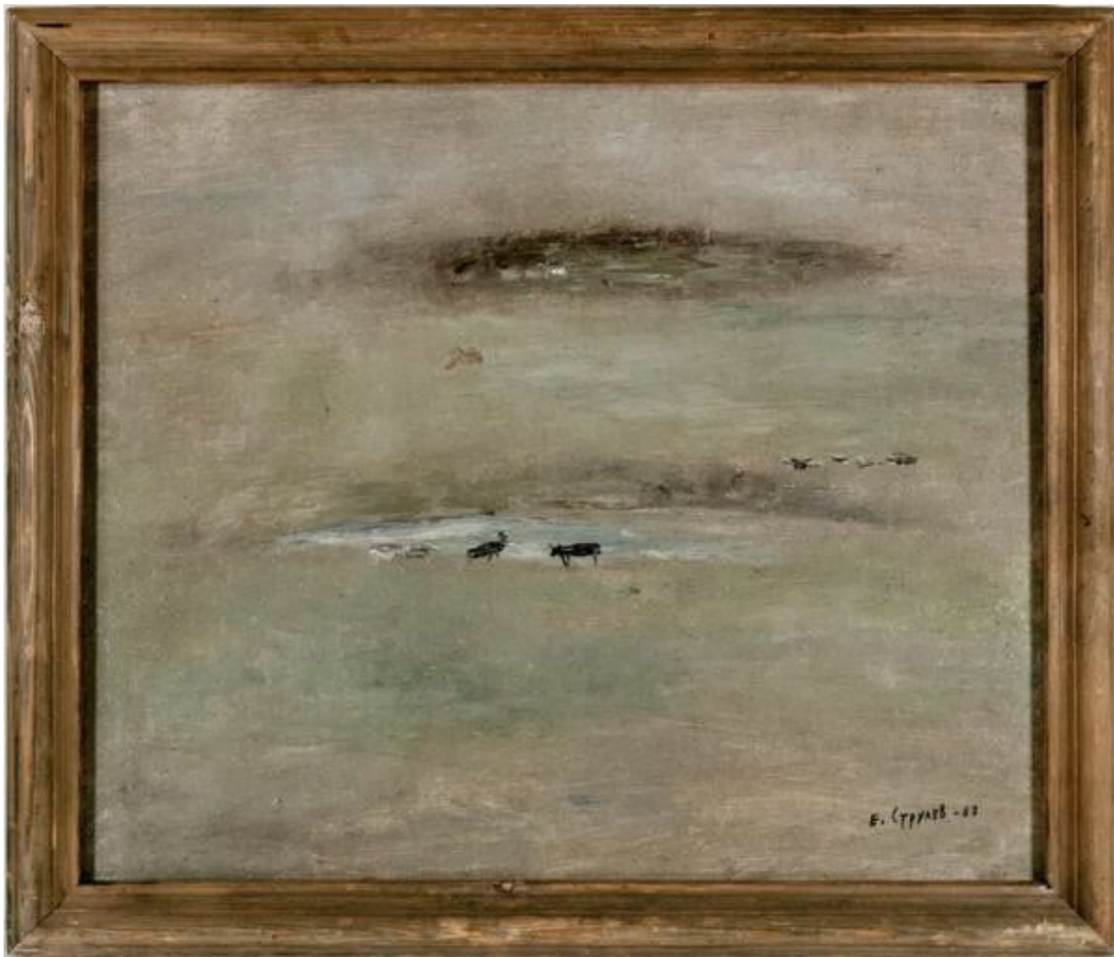
◦ Стадо (1987) холст,масло, 50x60