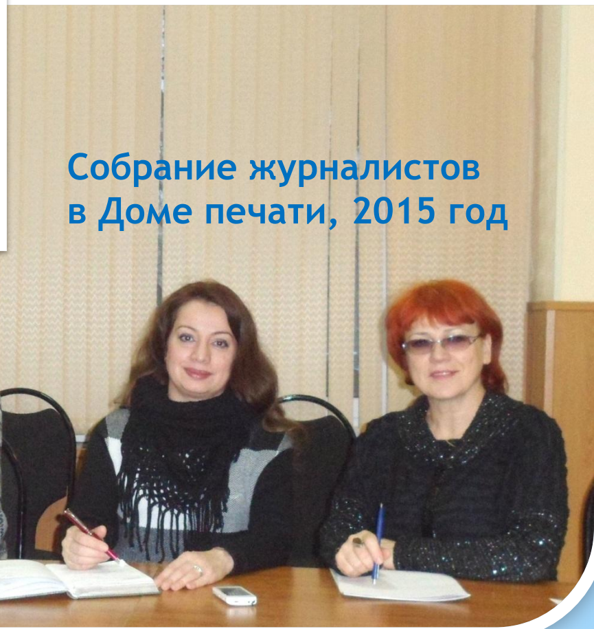
Собрание журналистов в Доме печати, 2015 год