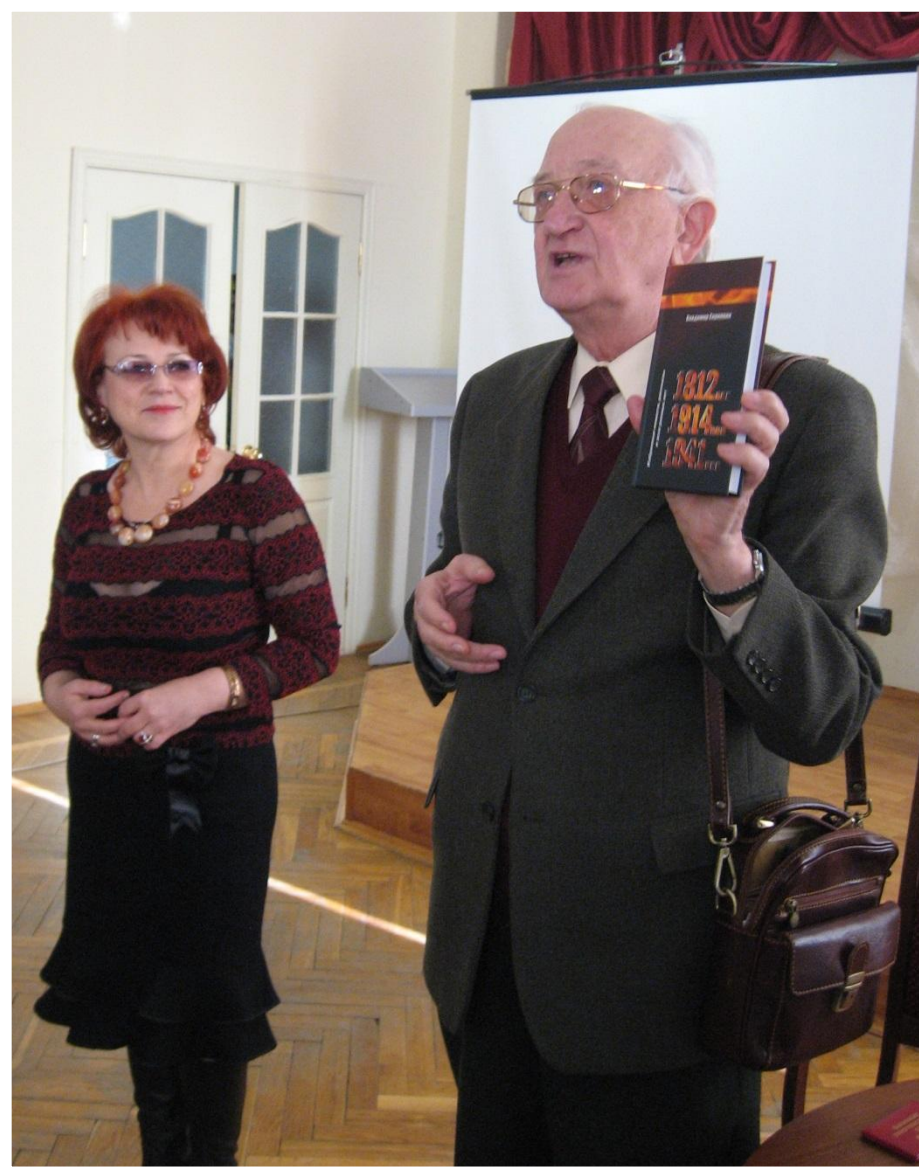
Вручение диплома лауреата областной литпремии им. Л. Леонова, 2014 г.