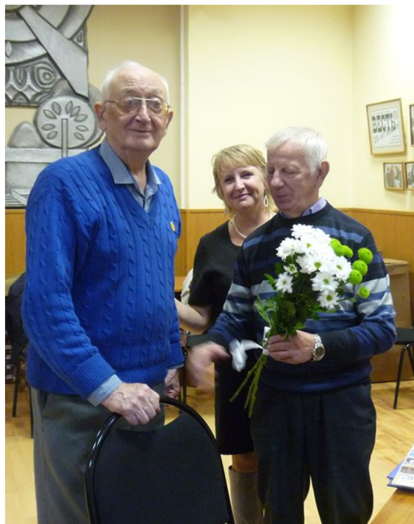
Поздравление с 80-летием, 2019 год