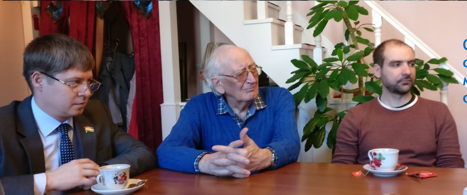
Общественный совет при минкультуры области, 2019г.