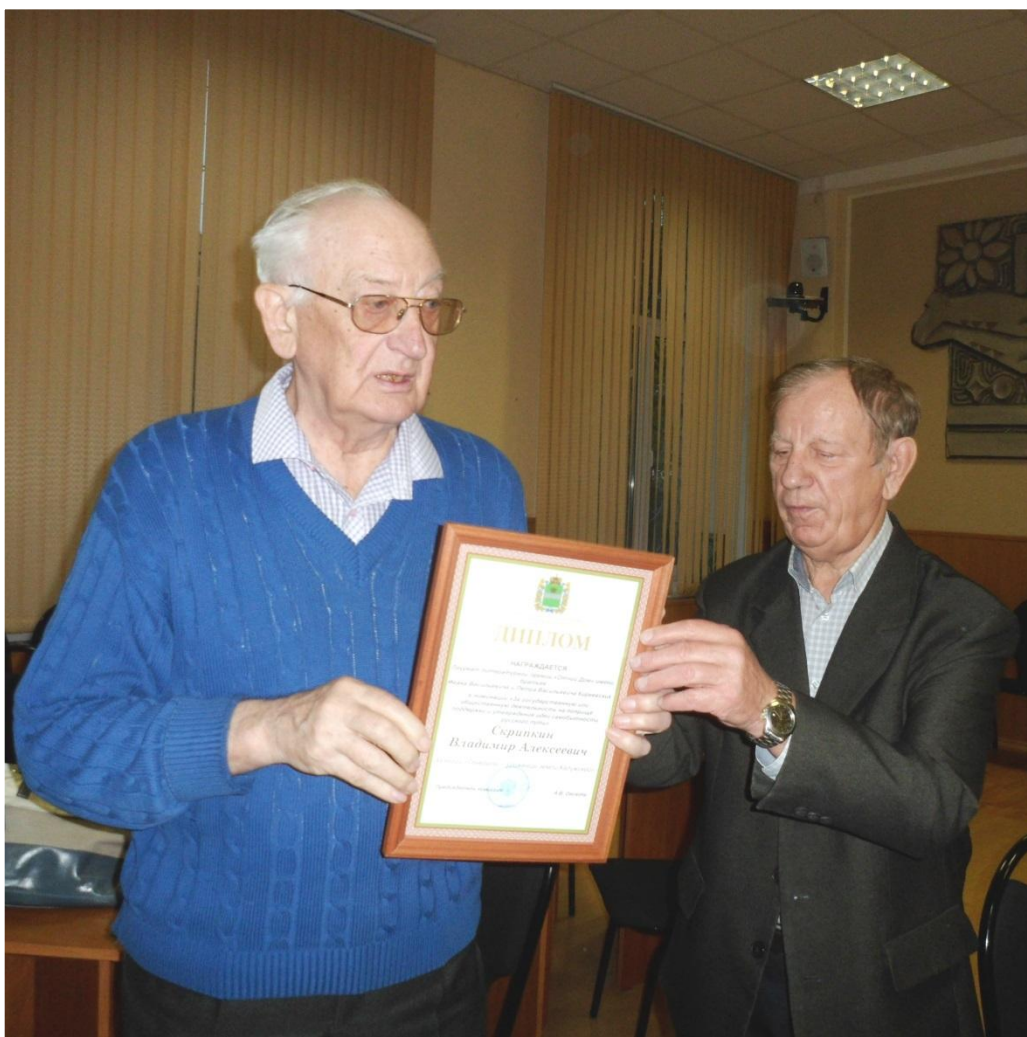
Вручение диплома лауреата областной премии «Отчий дом» им. Братьев Киреевских, 2017 год