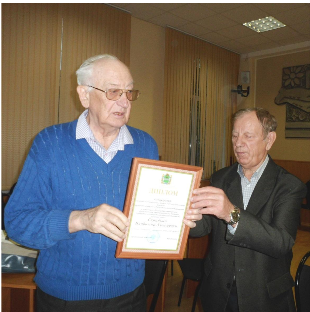
Вручение диплома лауреата областной премии «Отчий дом» им. Братьев Киреевских, 2017 год