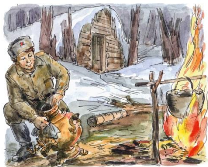
Модель «Самовар» стр. 11 Рейдлер