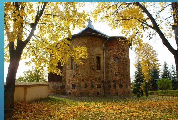
Борисоглебская (Коложская) церковь