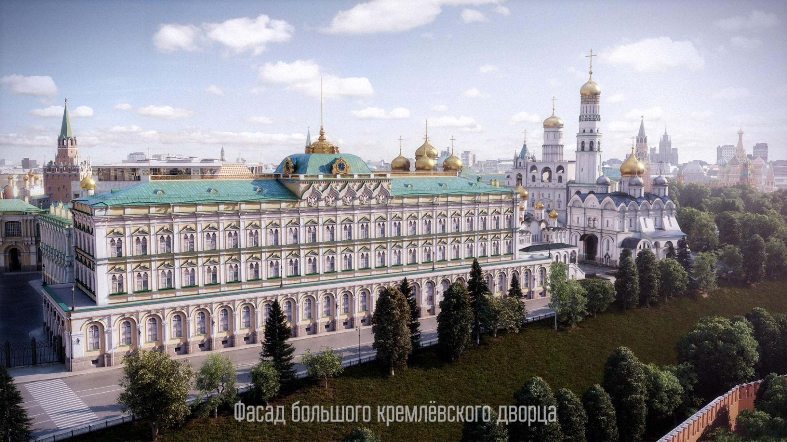
Фасад большого кремлёвского дворца