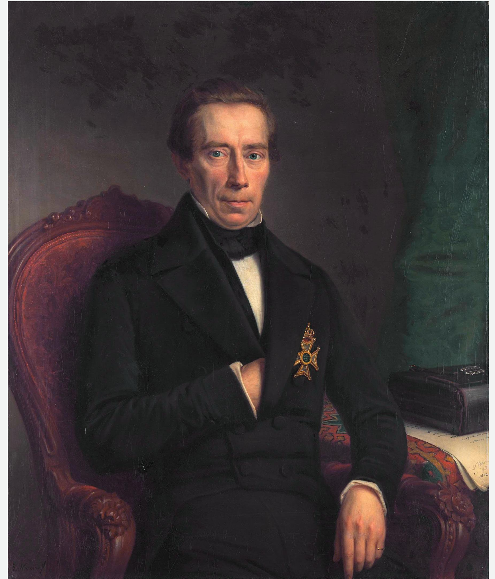
Йохан Рудольф Торбеке

Активно работал в подобном ключе и Йохан Рудольф Торбеке. В 1840 г. он возглавил либеральную партию, а позже возглавлял уже правительство Нидерландов. Затем занял пост министра внутренних дел и председателя Совета Министров. Во время нахождения у власти кабинета Торбеке в 1862-1866 произошли следующие изменения: Введение парламентского контроля над управлением Голландской Ост-Индией (ныне Индонезия) в 1864 г.; Издание «Закона об отчетности», который предусматривал ежегодное утверждение в Генеральных штатах бюджета Индонезии; Уменьшение таможенных налогов в 1862 г.; Поэтапная ликвидация «системы культур».