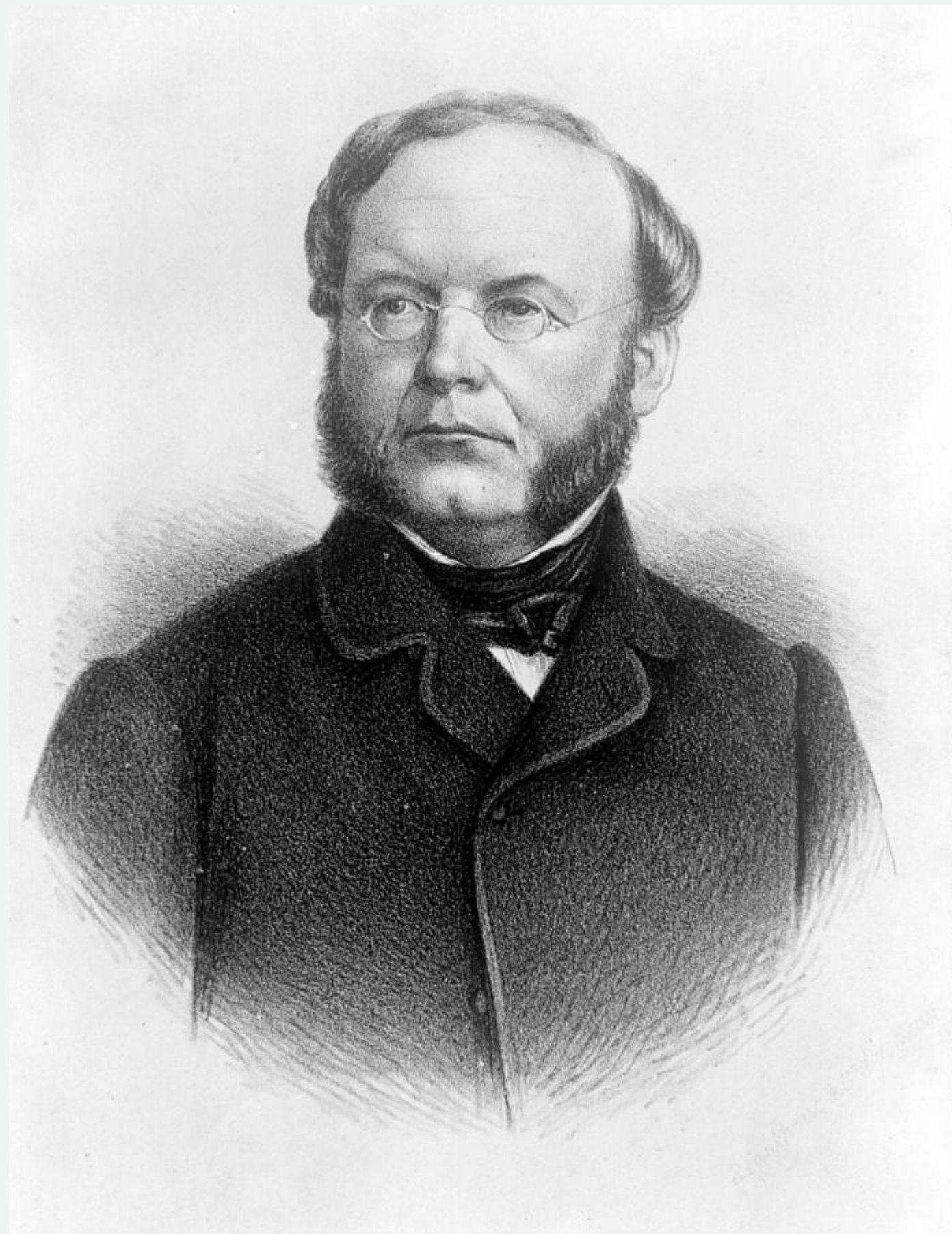
Барон Волтер Роберт Хувелл

«Система культур» подвергалась в Нидерландах все более жесткой критике. С 1850 г. колониальная проблема стала неотъемлемой частью повестки дня нижней палаты Генеральных штатов. Активно выступать против «системы культур» начали представители радикально настроенного крыла либералов. Они обращали внимание на «этическую сторону эксплуатации туземного населения». Барон Волтер Роберт Хувелл открыто заявил, что действия нидерландцев в Индонезии мало согласуются с новой либеральной политикой. Его поддержал Эдуард Доувес Деккер, он прослужил более 17 лет в колониальной администрации и прекрасно представлял реальную картину жизни яванцев, поэтому призывал отменить «систему культур». В своих работах Эдуард Доувес Деккер обличал методы эксплуатации туземного населения Явы, но при этом призывал колониальные власти, прежде всего, защищать яванцев от угнетения коррумпированными местными правителями.