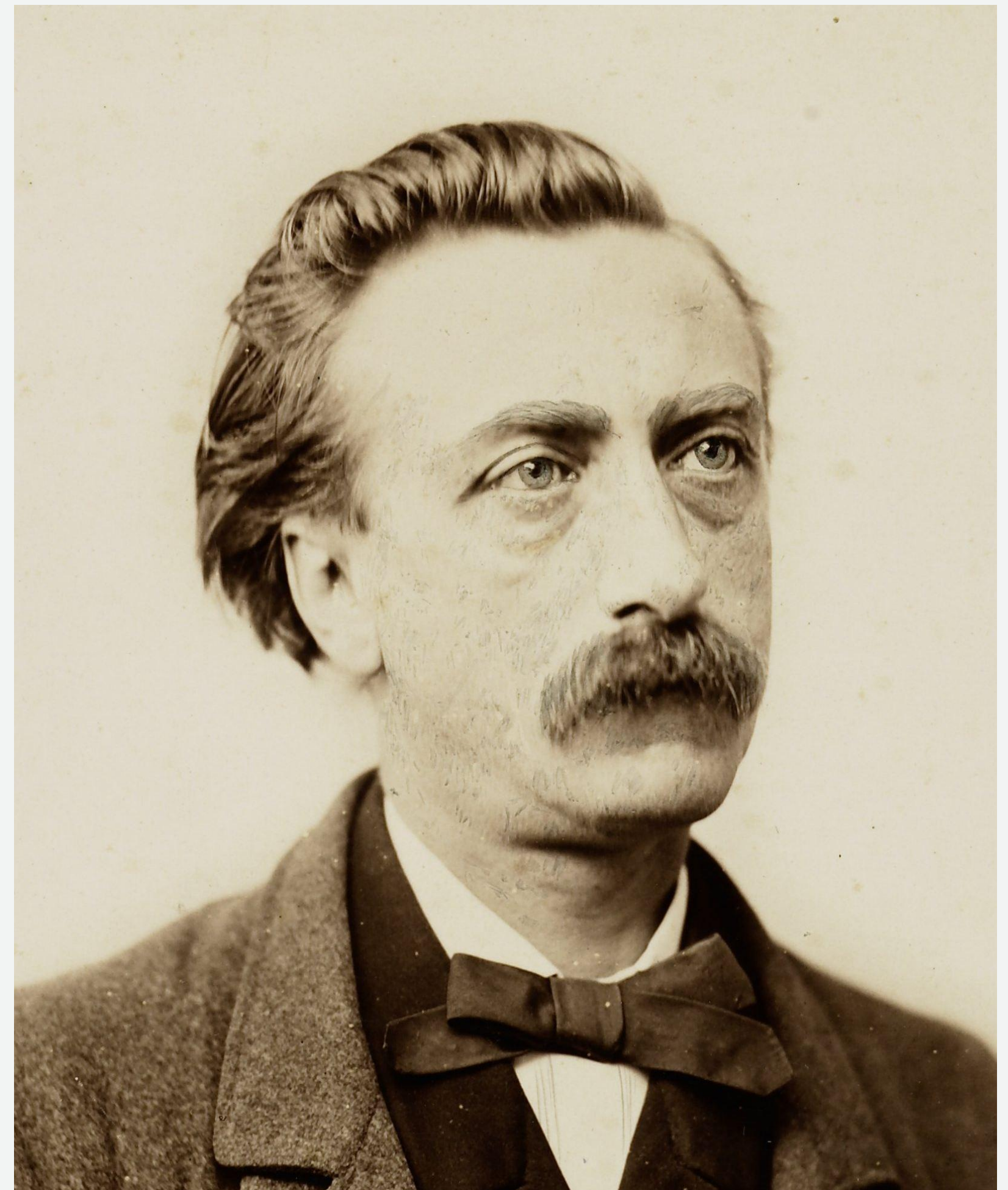
Эдуард Доувес Деккер

С течением времени отношение Нидерландов к колониям становилось менее потребительским. Во многом это связано с победой либералов на голландской внутривнутриполитической арене. Наиболее ярким обличителем колониализма в XIX в. выступил писатель Эдуард Доувес Деккер. Так, в 40-е гг. XIX в. в Генеральных штатах Нидерландов сформировалась либеральная оппозиция, в выступлениях которой все чаще звучали слова о бесконтрольной власти короля над колониями, диктаторской власти генерал-губернаторов и требования решать важнейшие дела колоний в парламенте.