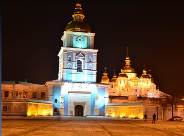
Софіївський собор. ➡