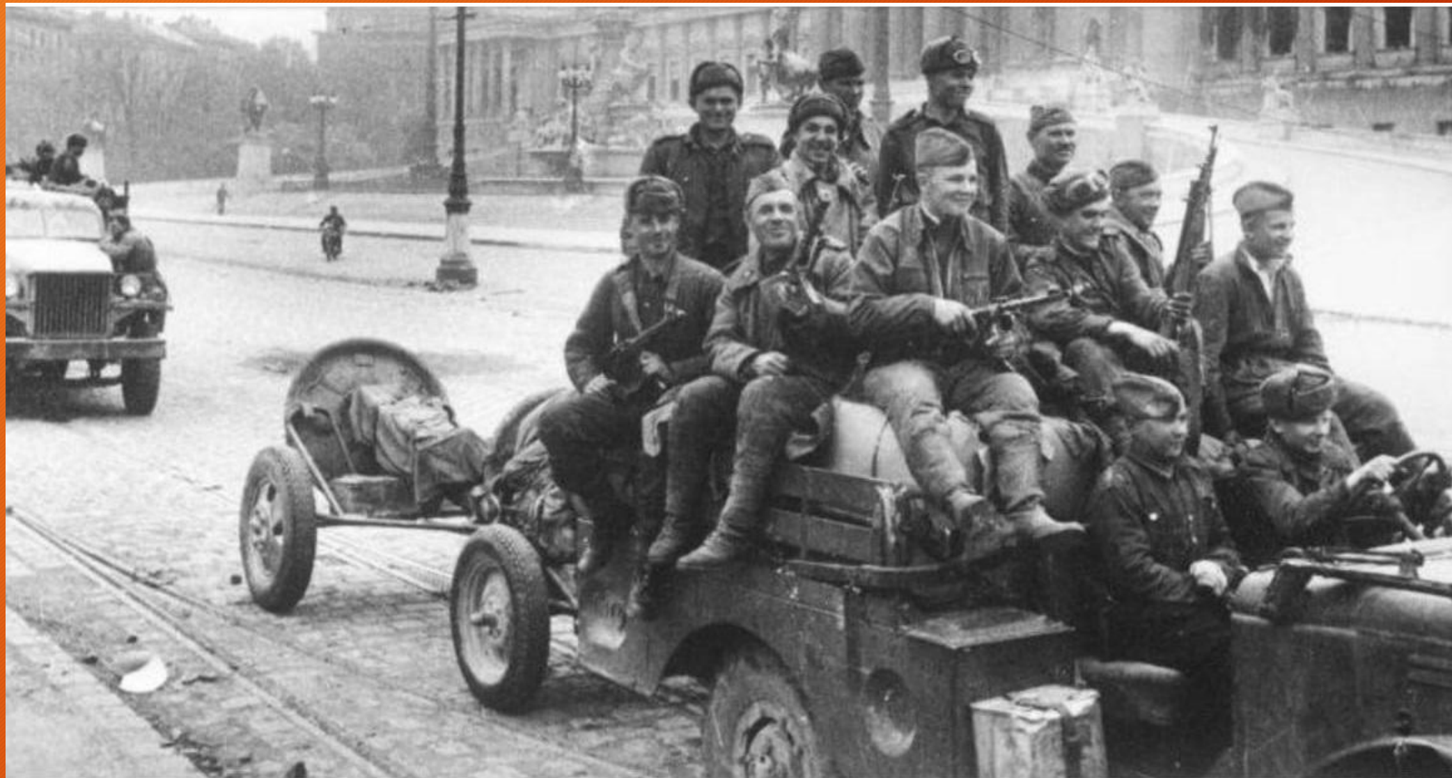
Подразделение советских минометчиков проезжает перед зданием парламента в Вене