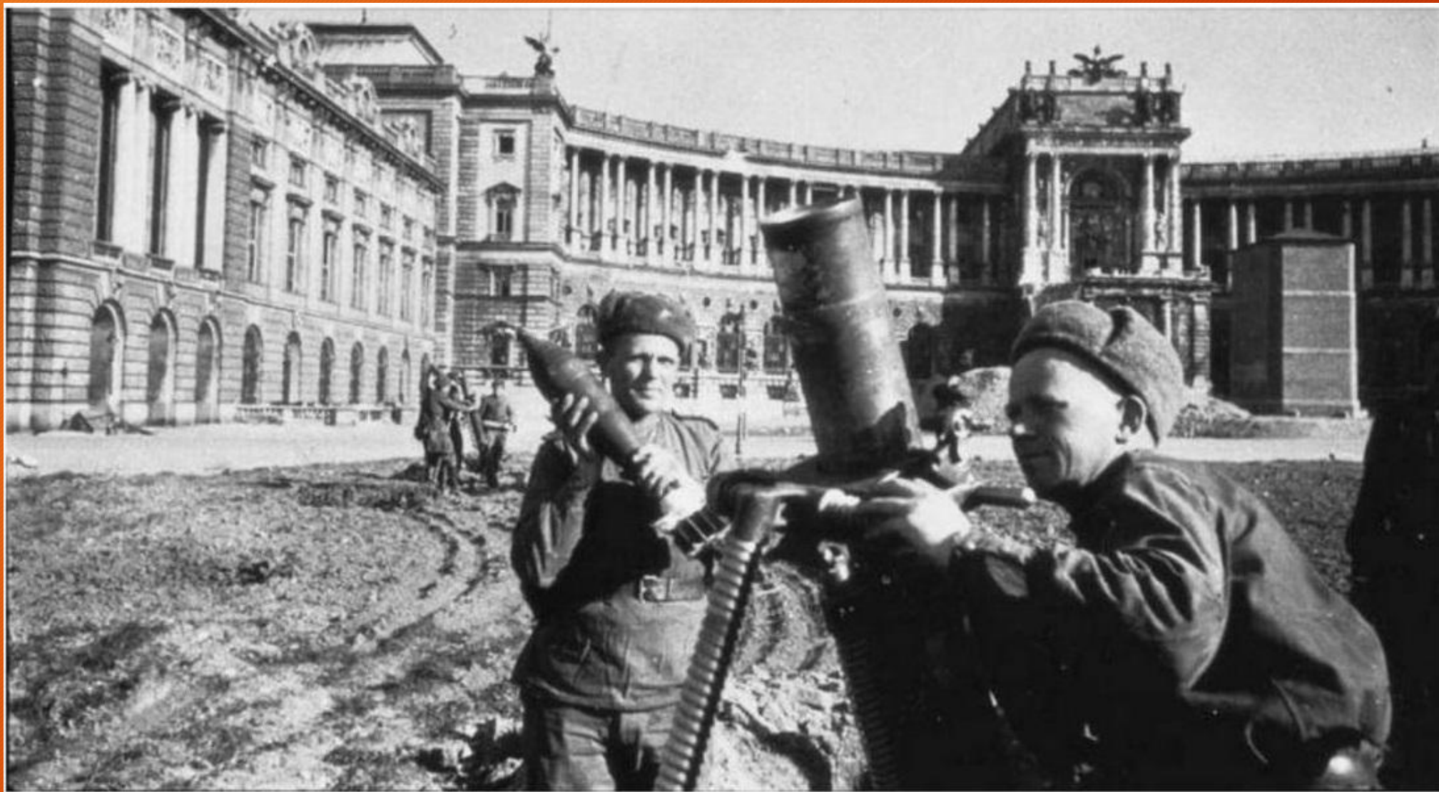
Советские минометчики с полковым минометом в Вене