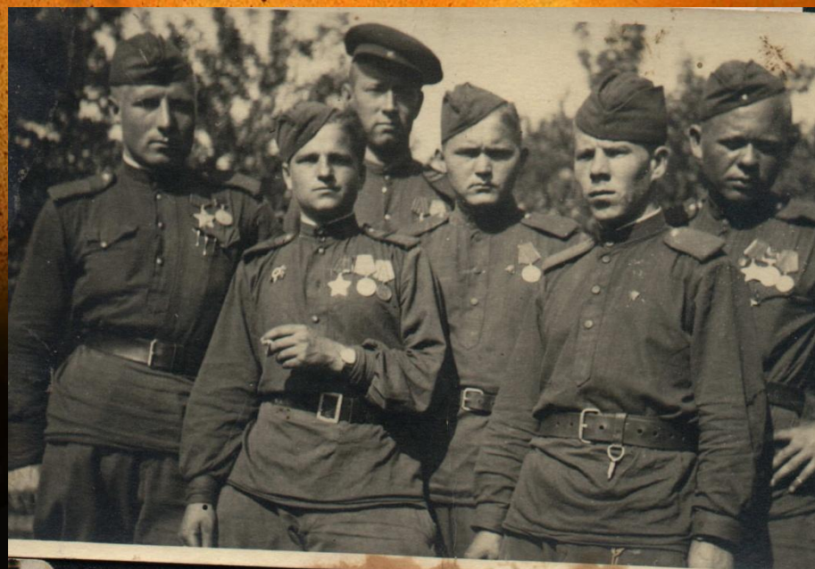
Прага. 1945 год.