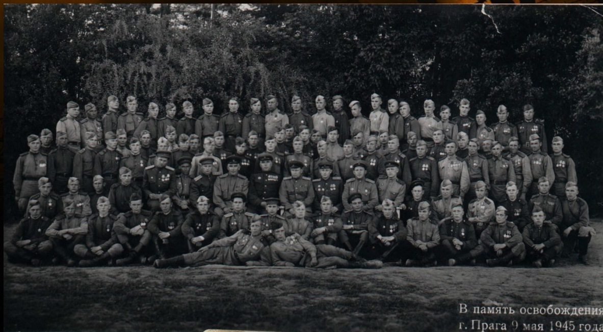
В память освобождения г. Прага 9 мая 1945 года