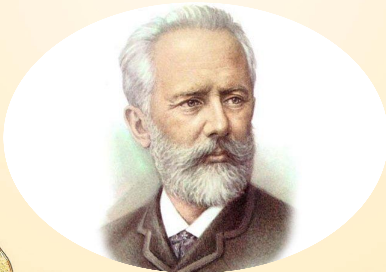
П. И. Чайковский ( 1840 – 1893 )