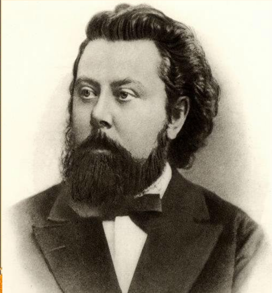
Виктор Александрович Гартман (1834- 1873) русский архитектор