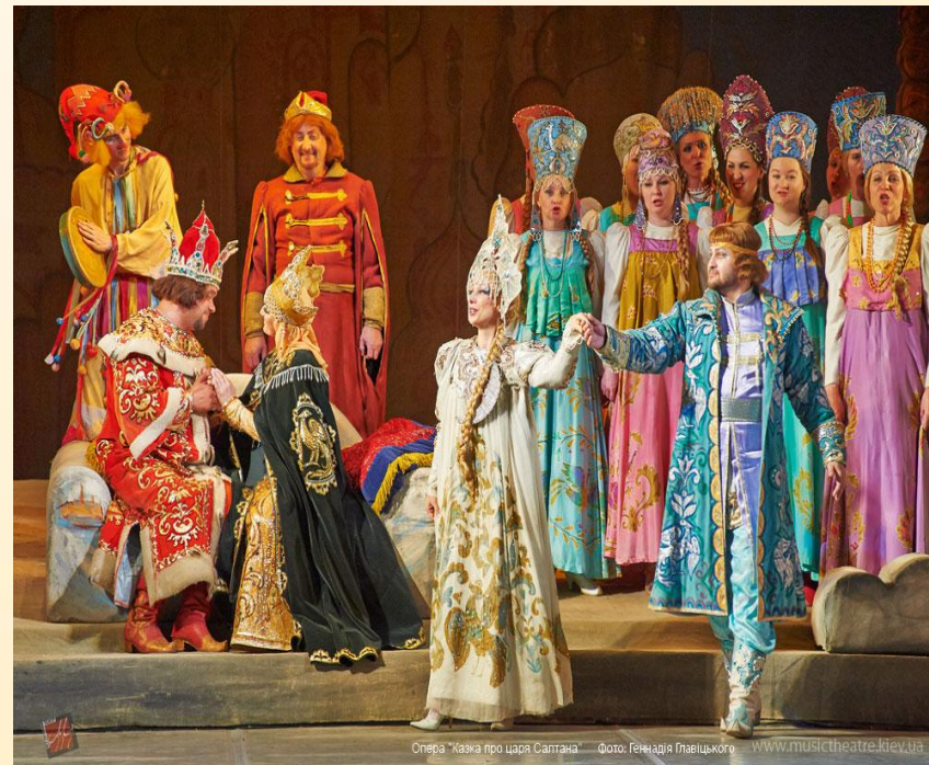
Опера "Сказка про царя Салтана" Фото: Геннадія Гляницького www.musictheatre.lviv.ua