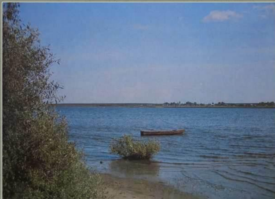
Волга в окрестностях Грешнева

Много проникновенных строк посвятил поэт великой мамушке Волге.