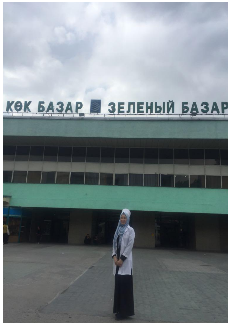
1-2 сурет. «Д-Маркет» ЖШС ішкі сауда объектісі