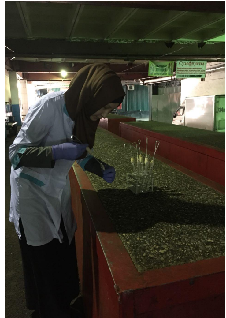
3-4 сурет. Қабырғаның төменгі бөлігі мен ұшалар қойылатын үстелден сынама алу сәті