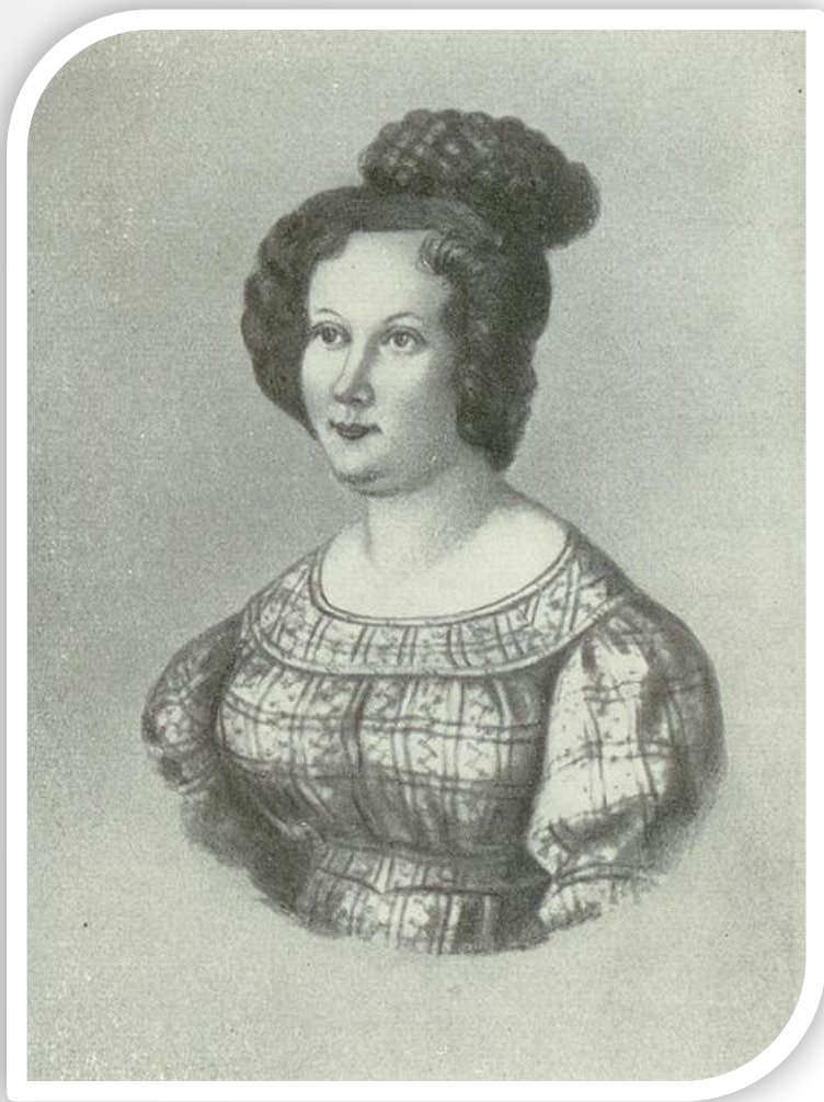
Екатерина Ивановна Трубецкая и Мария Николаевна Волконская