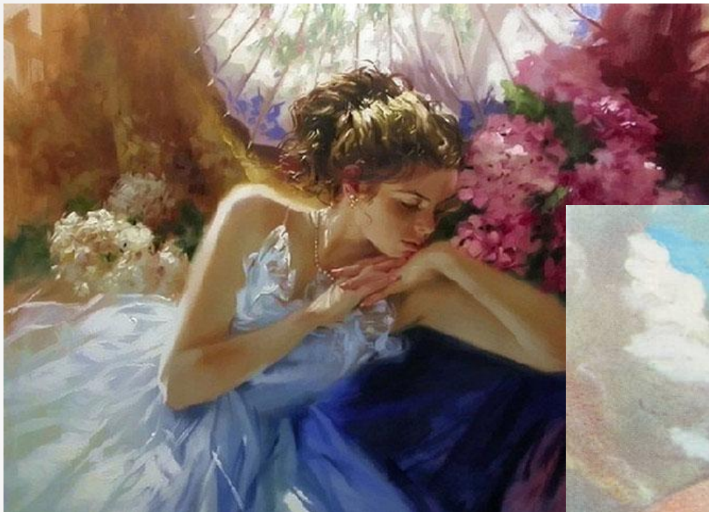
Нет ничего прекраснее на свете женщины (Ф.И. Тютчев)