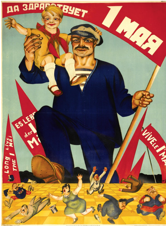
«Да здравствует 1 Мая» П. Соколова-скаля, 1928

Плакат рассказывал о значении советских праздников.