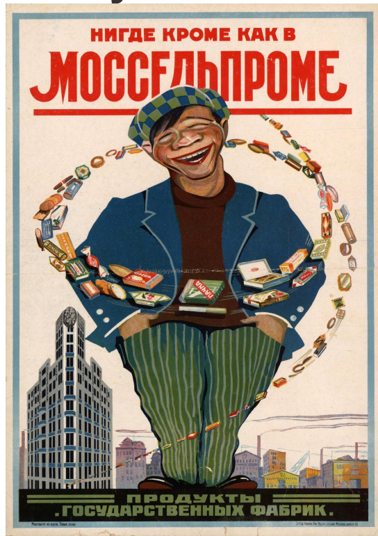
М. Буланова «Нигде как в Моссельпроме. Продукты государственных фабрик» (1926)

В плакатах уже использовался не фотомонтаж, а рисунок.