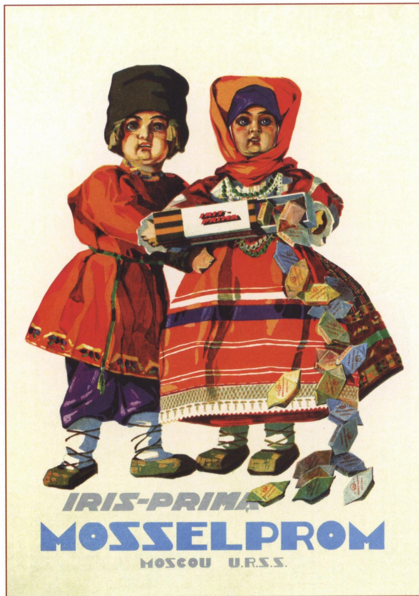
529. Зеленский А. Ирис-прима. Моссельпром. 1930

В 1930 -х гг. « Моссельпром » производил товары для экспорта за границу.