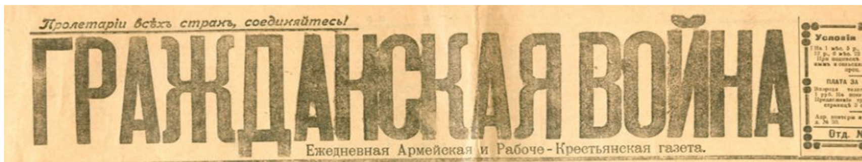
Рис.1. Вырезка из газеты

Предмет: Изучение истории Гражданской войны в Иркутской области по материалам СМИ.