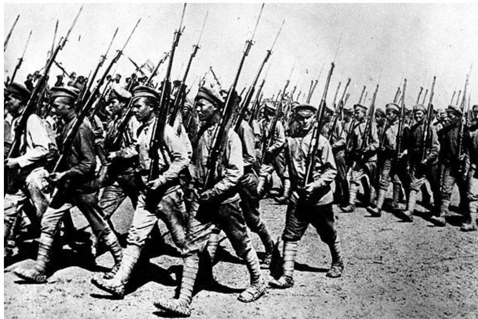
Рис.2. Гражданская война

Гражданская война - ожесточенная вооруженная борьба за власть между различными социальными группами одной страны.