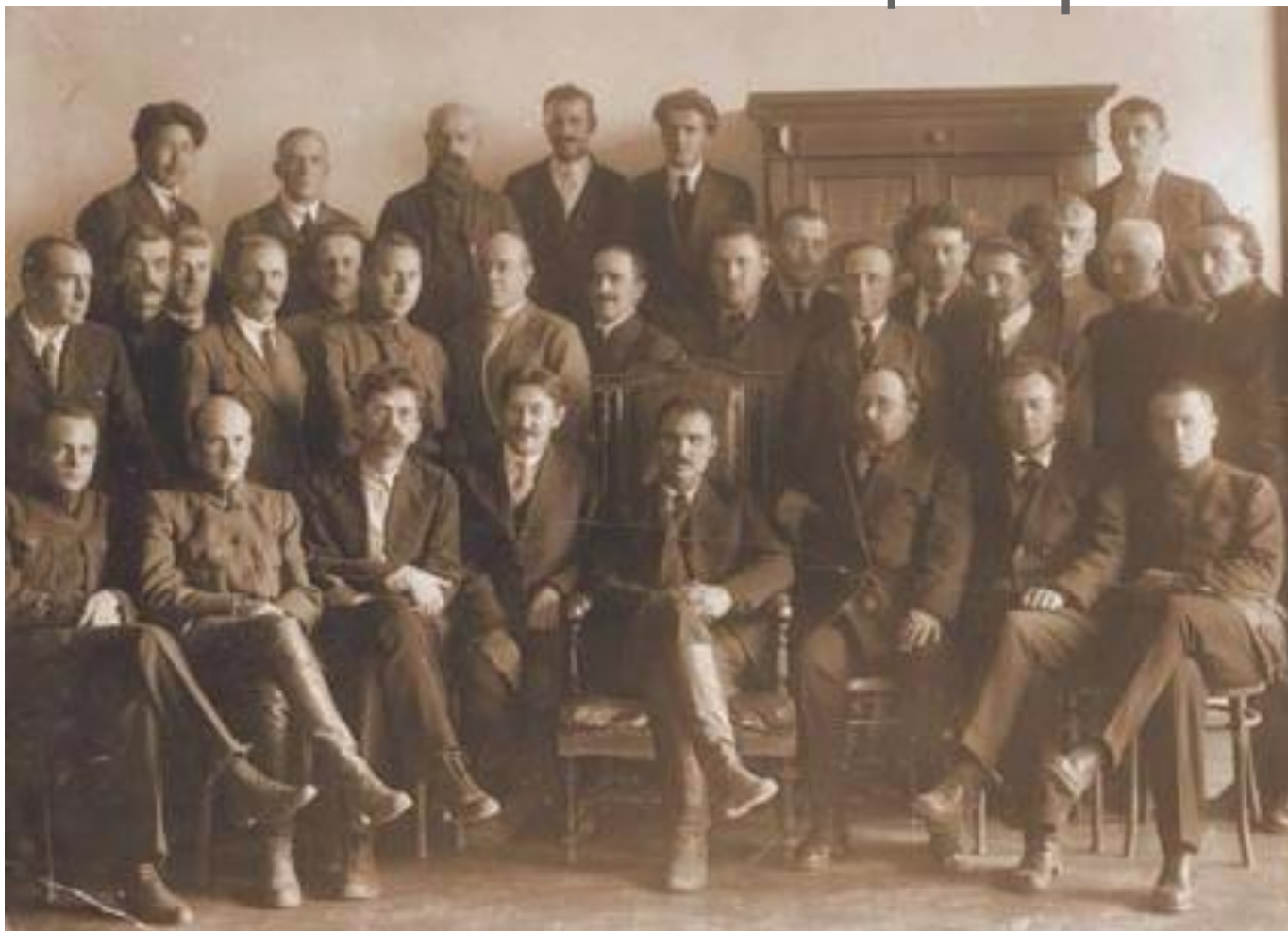
Рис.5. Члены Политцентра