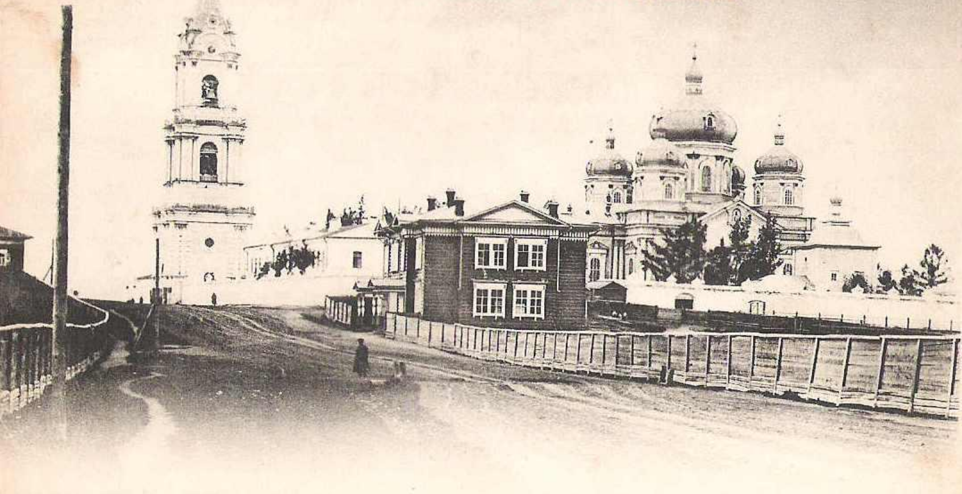
Иркутскъ.—Irkoutsk. № 37. Вознесенскій монастырь.—Le couvent de l'Ascension.