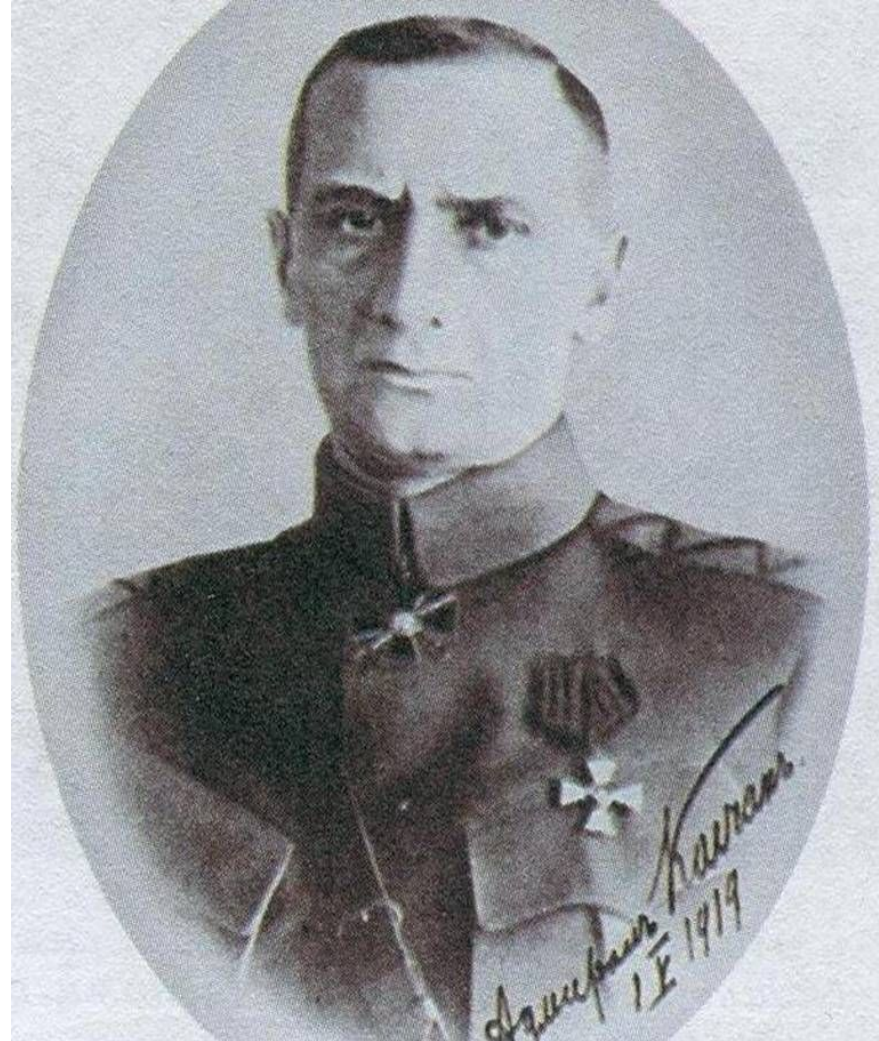
Рис.4. Адмирал А.В. Колчак