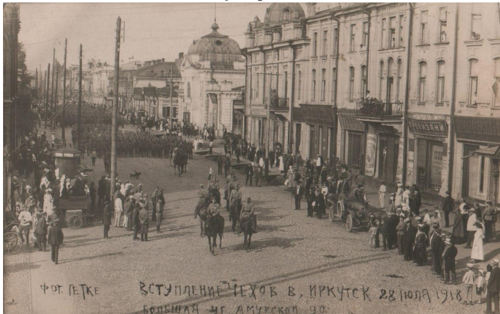
Рис. 5. Вступление чехов в Иркутск