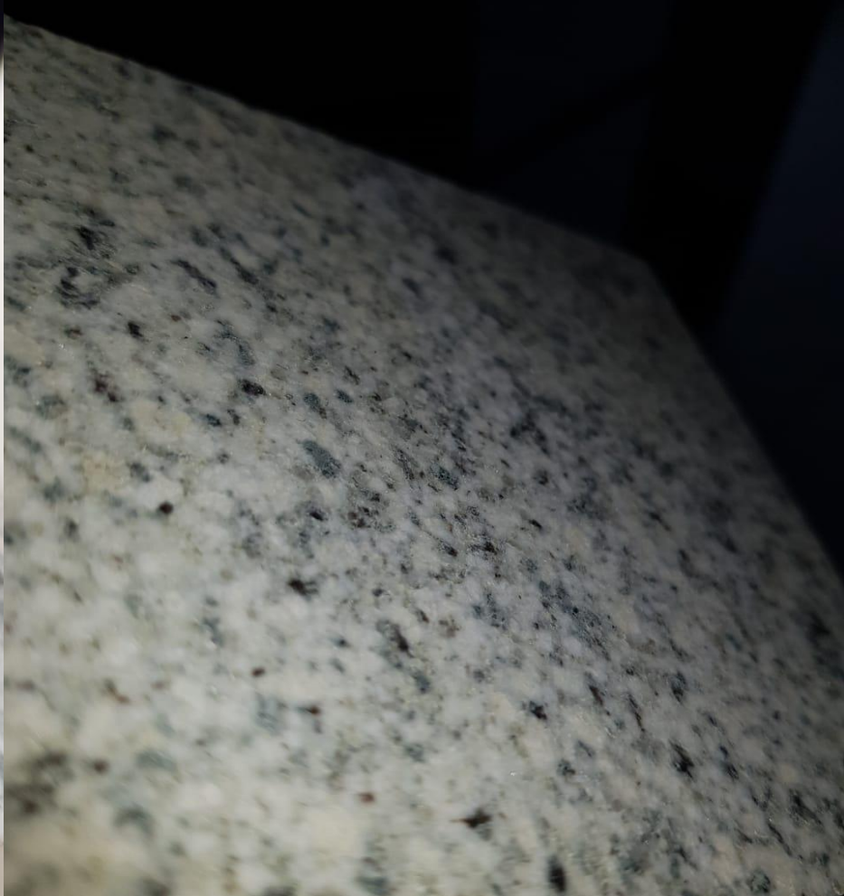
мансуровский гранит для отделки вашего бассейна