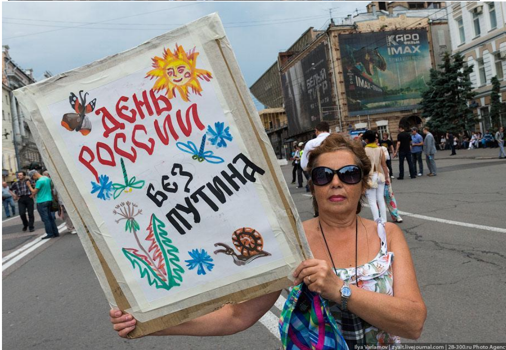
Ilya Varlamov | zyalivejournal.com | 28-300.ru Photo Agency