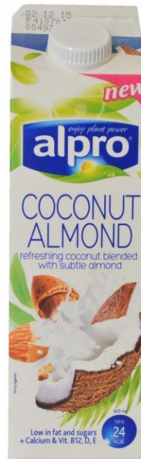
Кокосово-миндальный напиток Alpro, Англия