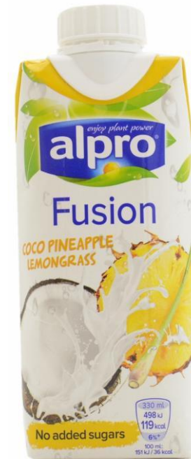
Напиток кокос-ананас (с кокосовым молоком) Alpro, Англия