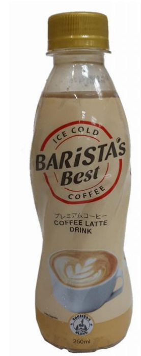
Кофейный напиток Asia Brewery, Таиланд