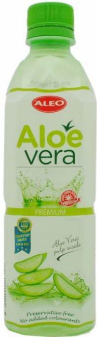
С кусочками алоэ Mega Baltic, Германия