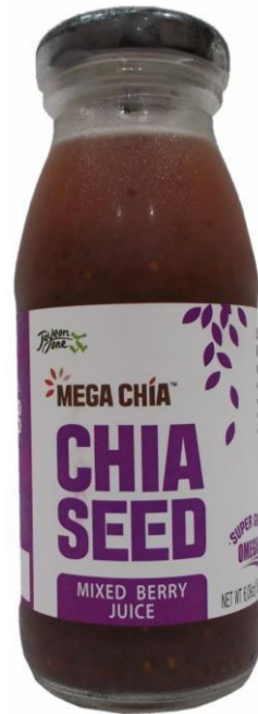
С семенами чиа Wellfarm, Юж.Корея