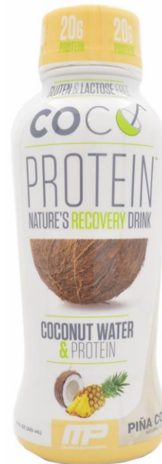
Кокосовый протеиновый напиток, вкус Пина-Колада Muscle Pharm, Юж.Африка