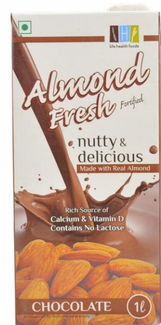
Миндальный напиток Life Health Foods, Индия