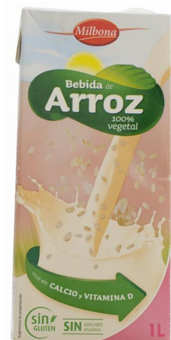
Рисовый напиток Lidl, Испания