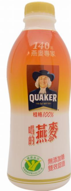
Овсяный напиток Standard Foods, Тайвань