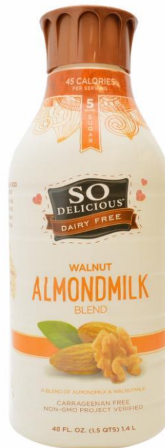
Ореховое молоко (грецкий орех и миндаль) So Delicious Dairy Free, США