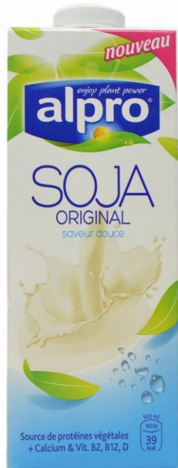
Соевый напиток Alpro, Франция