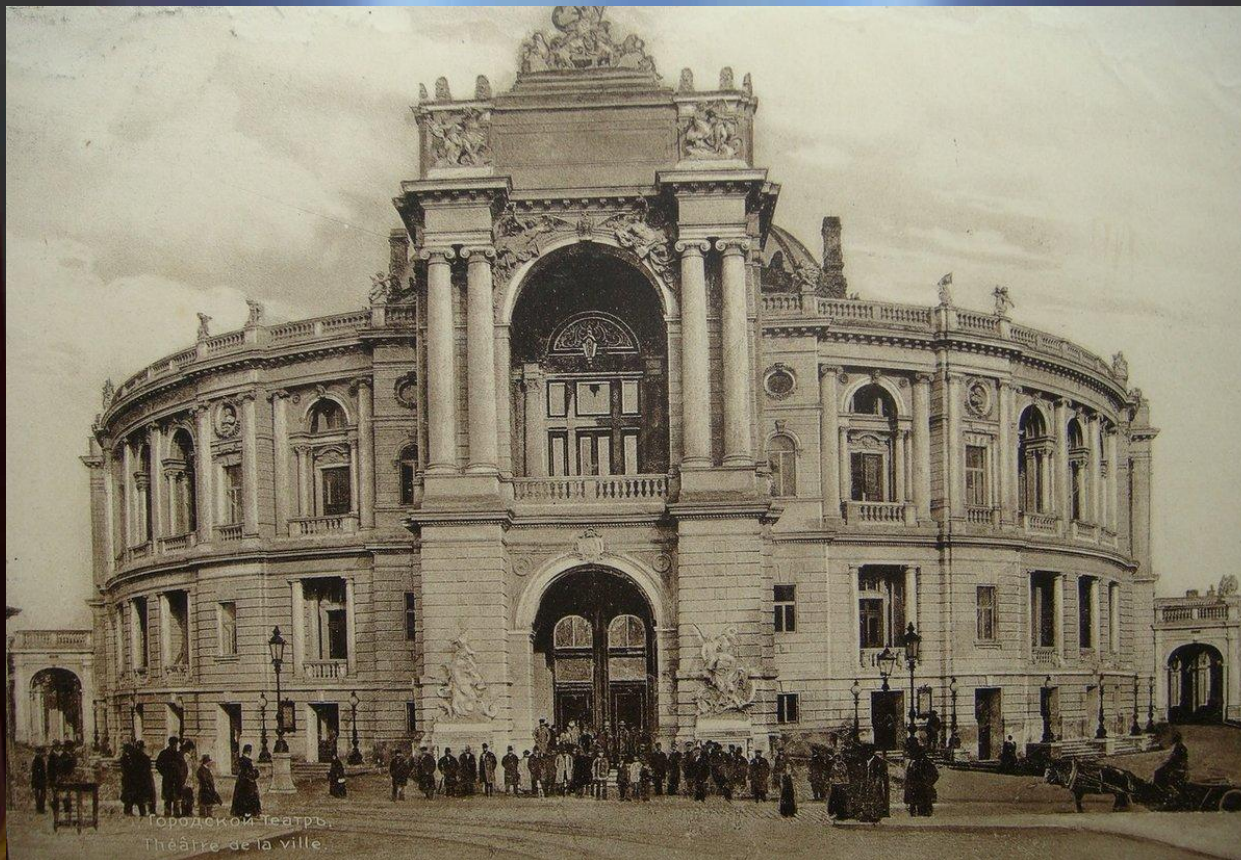
Городской театр, Théâtre de la ville

И еще 1 поездка в театр, театр – сюрприз, театр – шоколад.