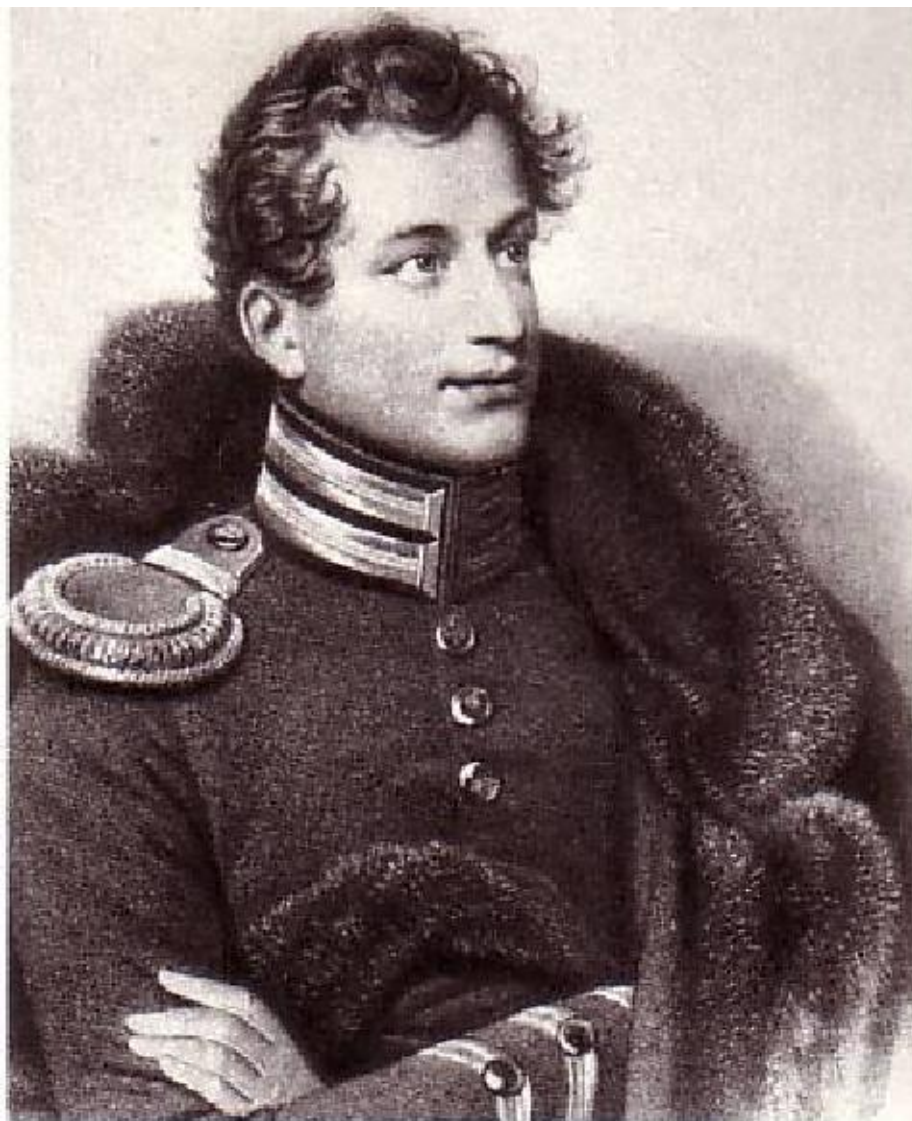
39. Портрет И.А.Анненкова Литография П.Смирнова 1861 г. с утрачен- ного портрета работы О.А.Кипренского 1823 г.