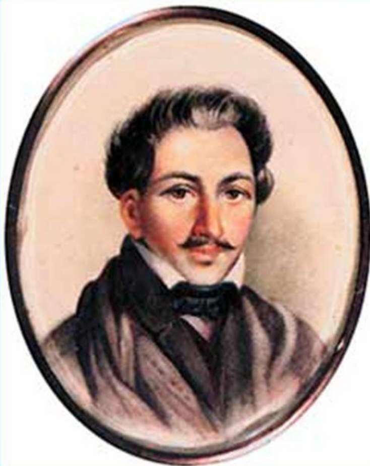
Пётр Григорьевич Каховский

Он родился в 1797 году в селе Преображенском, учился в пансионе при Московском университете: участник войны и заграничных походов 1813—1814 гг.