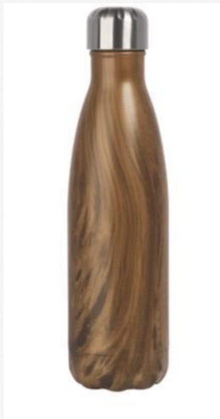
Арт.1050 990,00р Термобутылка «Кедр»