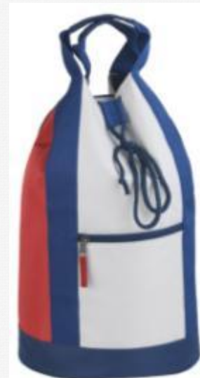
Арт. 9709 1980,00р Сумка спортивная «Россия»