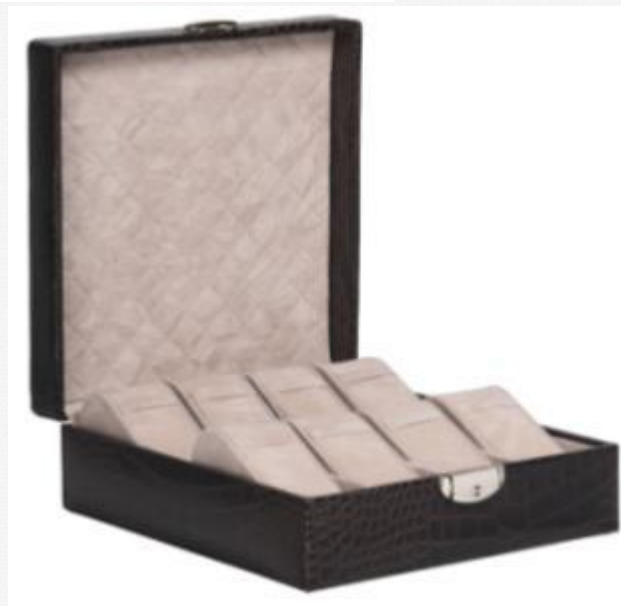
Арт. 5015 4430.00р Шкатулка для часов Capricio