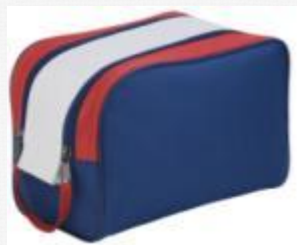
Арт. 3254 750,00р Несессер «Россия»