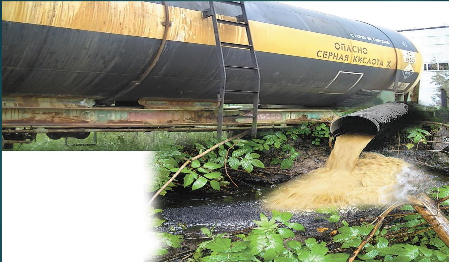
Слив серной кислоты.