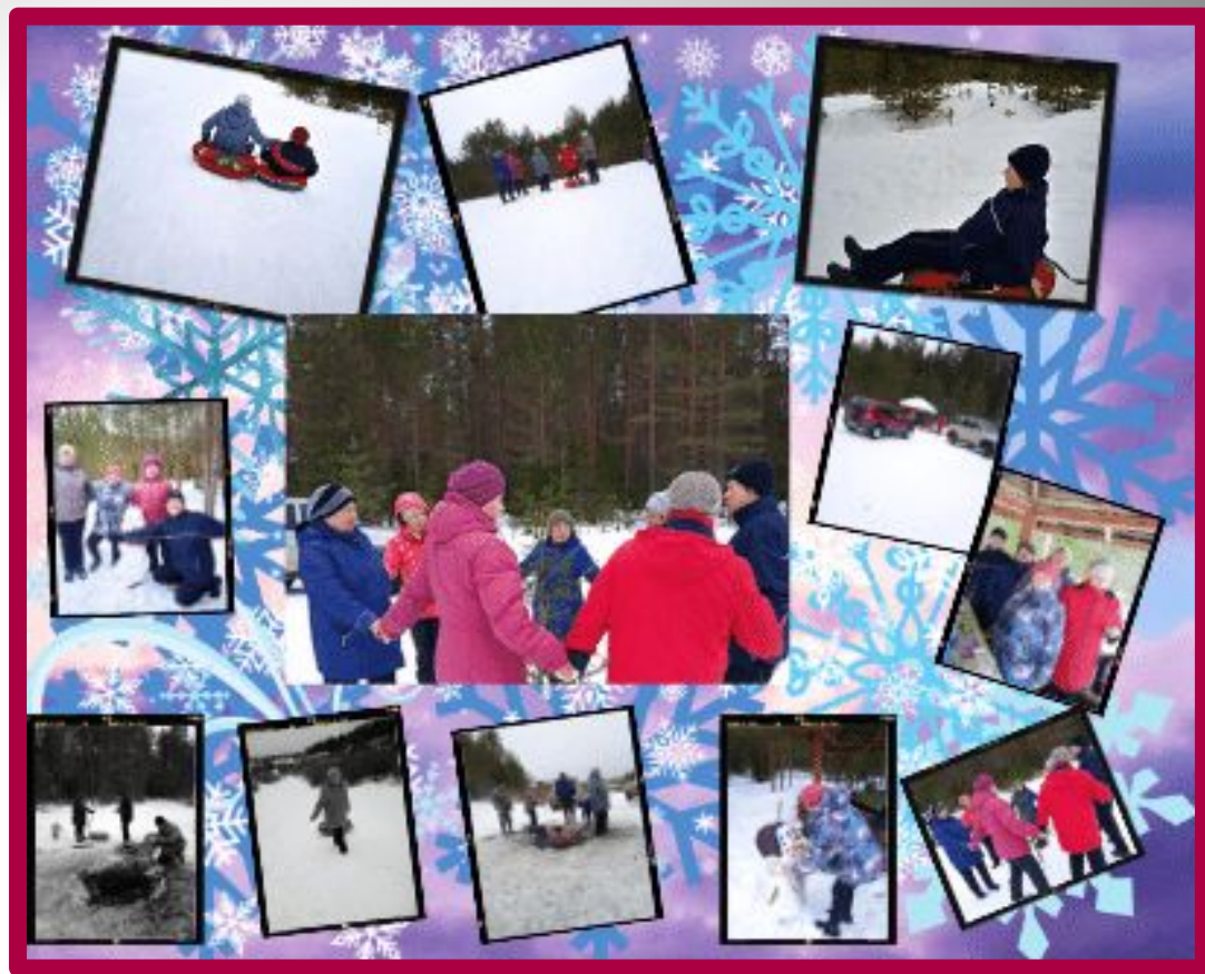
Осваиваем компьютер. Создание коллажа.