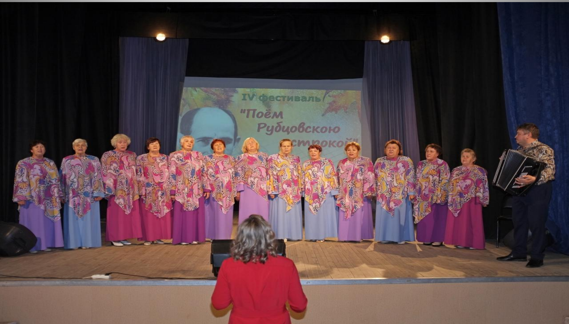
Выступление хора ветеранов на фестивале