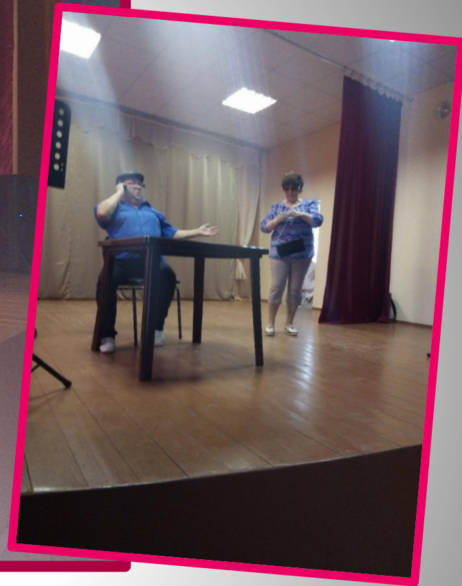
Хор ветеранов с концертными номерами по приглашению в Мосеевский с/с в период избирательной компании 2021г.