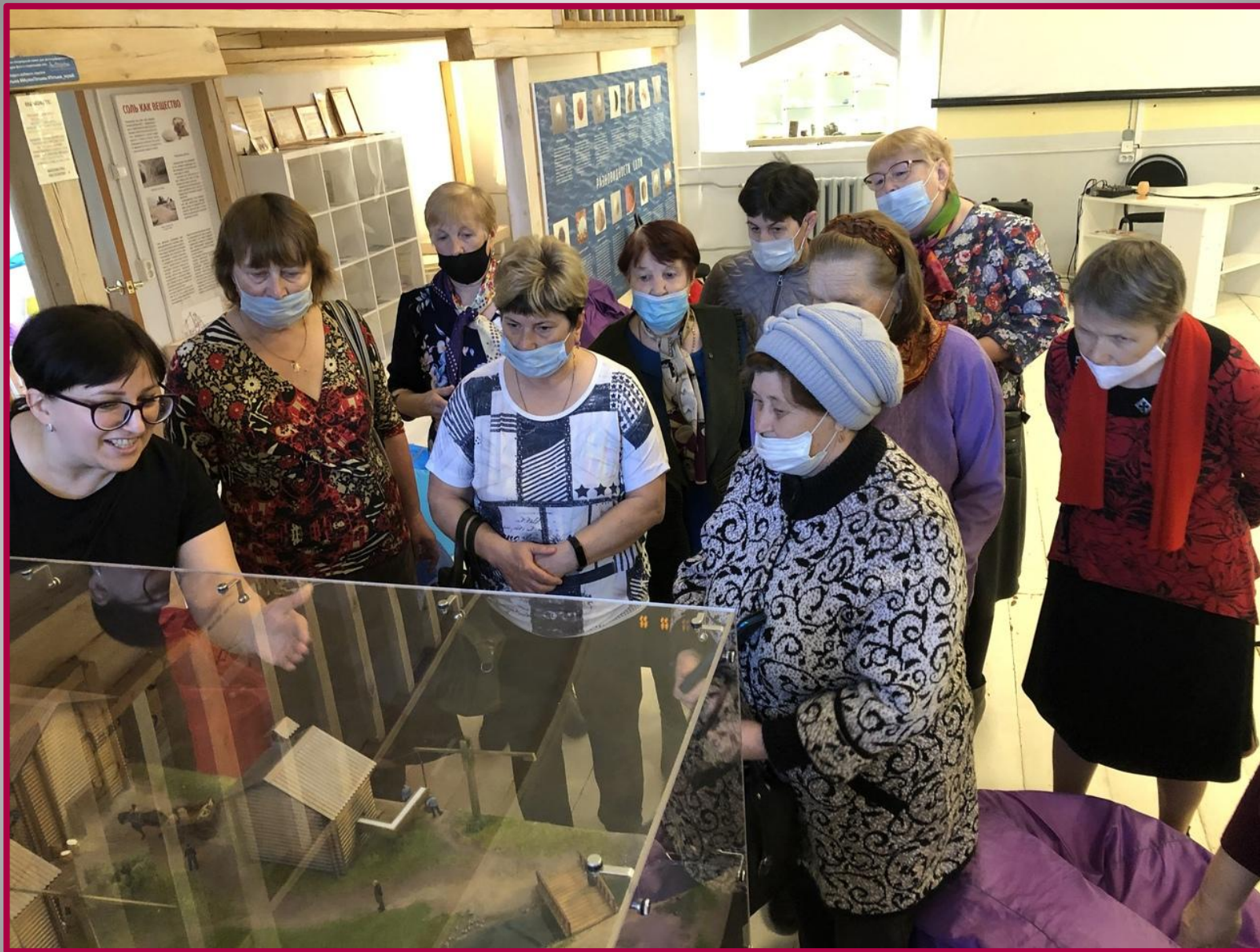
Экскурсия в музей