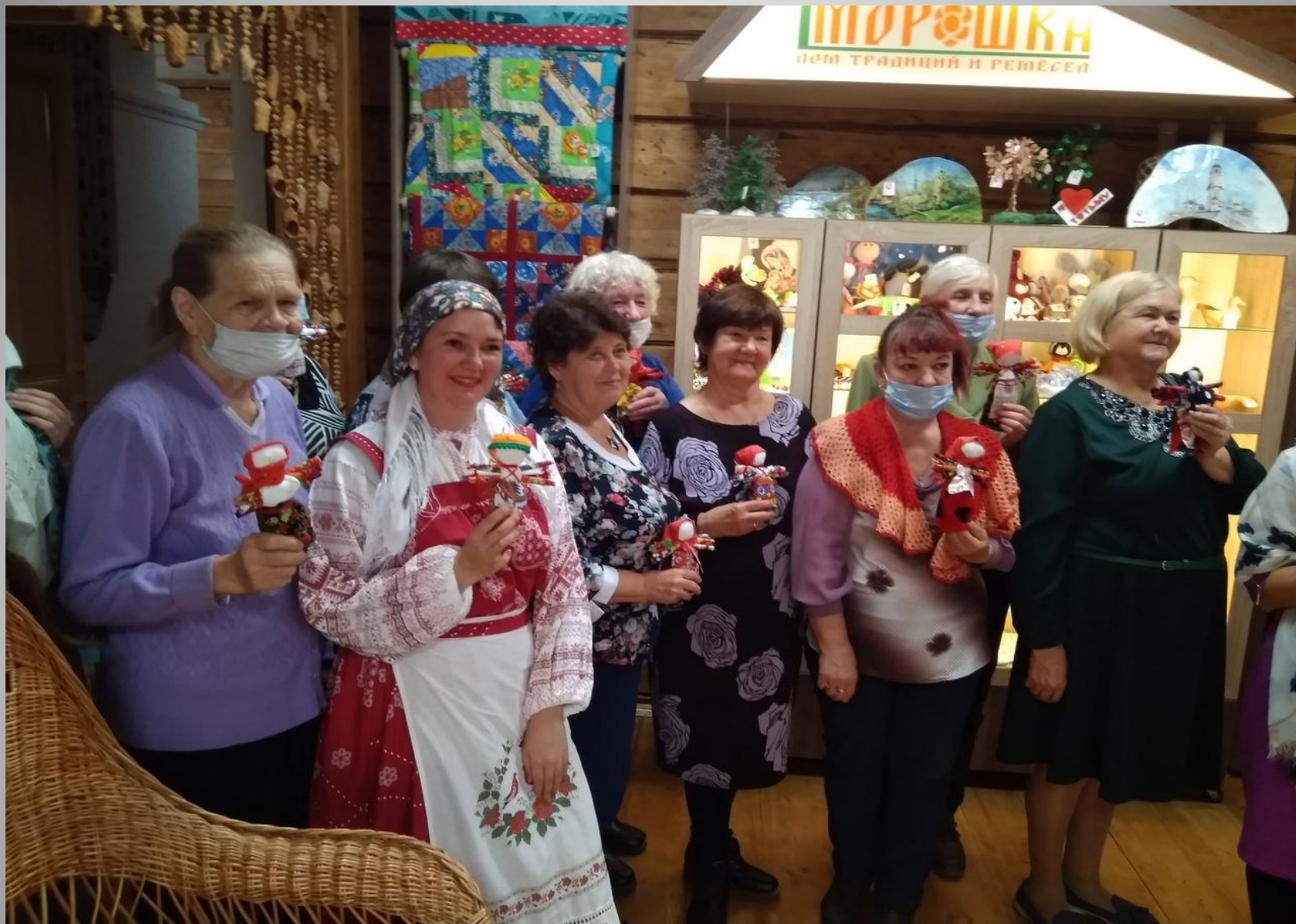
Покров день в музее «Морошка» , мастер класс по изготовлению куклы десятиручки.