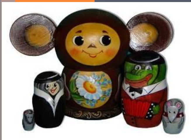
Крокодил Гена и его друзья