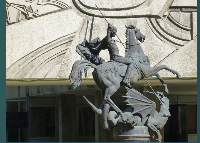
In the yard of the Studio of military artists named after Grekov.