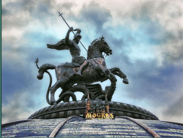
On Manezh square.