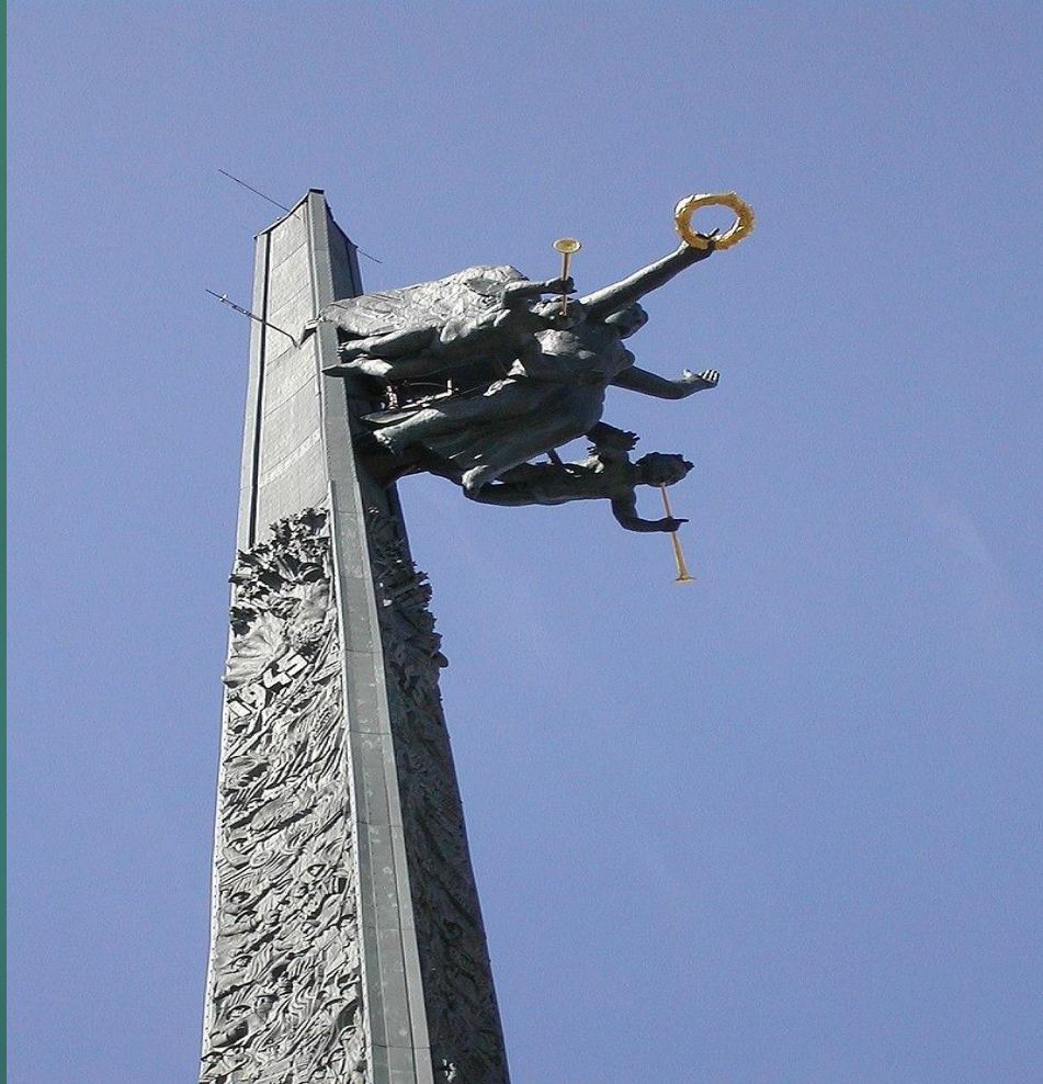
The goddess of victory Nika holding a wreath in her hand and surrounded by the figures of two angels with trumpets