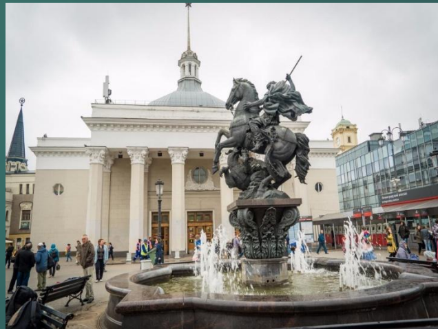
On Komsomolskaya square