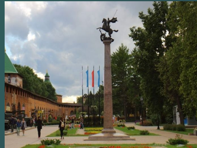
In the Kremlin.