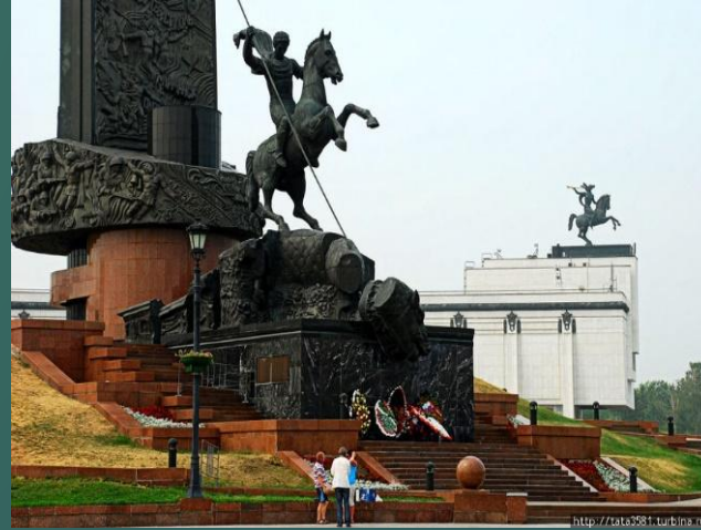
On Poklonnaya hill at the obelisk of Victory.