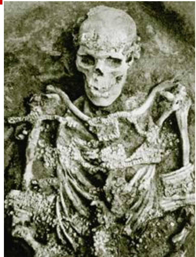
Погребение мужчины Сунгирь 1 (Россия, Владимирская область)