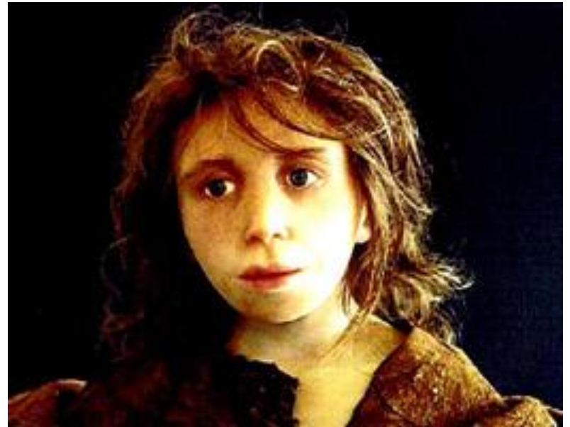
Реконструкция облика ребенка Гибралтар 2