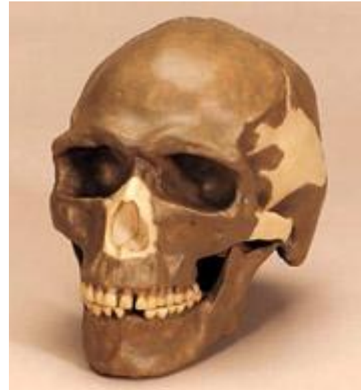
Череп верхнепалеолитического человека из Пшедмости в Чехии, ранний кроманьонец с рядом примитивных черт