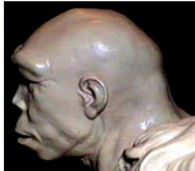
Реконструкция облика Кабве (Брокен Хилл) из Замбии, первоначально описанного как Homo rhodesiensis