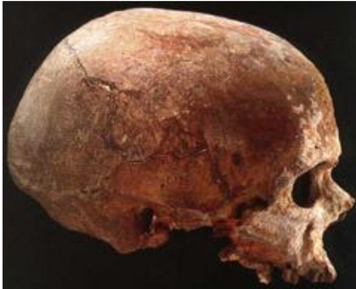
Череп Кро-Маньон 1 (Франция), по которому названы все кроманьонцы