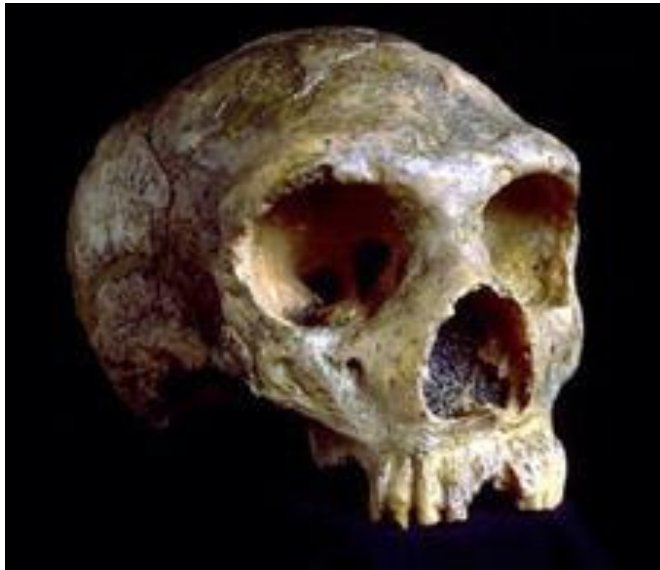
Гибралтар 1, один из первых найденных черепов неандертальцев