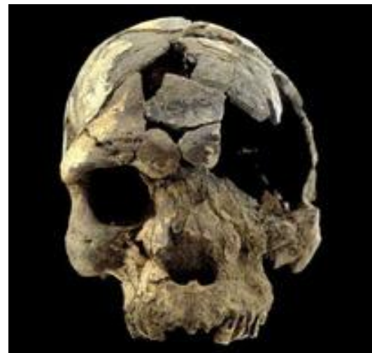
Череп Херто из Эфиопии, имеющий датировку 160 тыс.л.н.