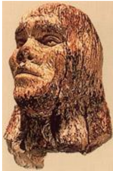
Портрет человека из бивня мамонта, найденный в Дольни Вестонице (Чехия)