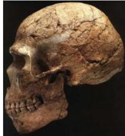
Череп Схул 5 из Израиля, имеющий, вероятно, датировку 119 тыс. л. н.