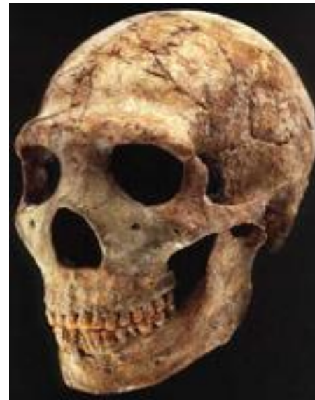
Череп Амуд 1 из Израиля