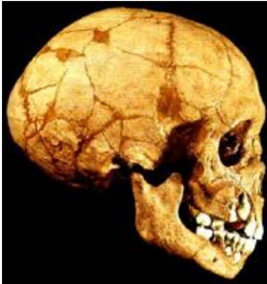
Череп ребенка неандертальца из грота Тешик-Таш в Узбекистане