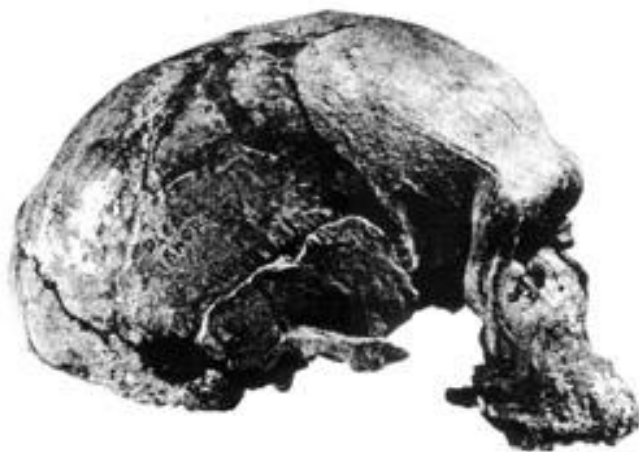
Череп Джебель Ирхуд 1 из Марокко;