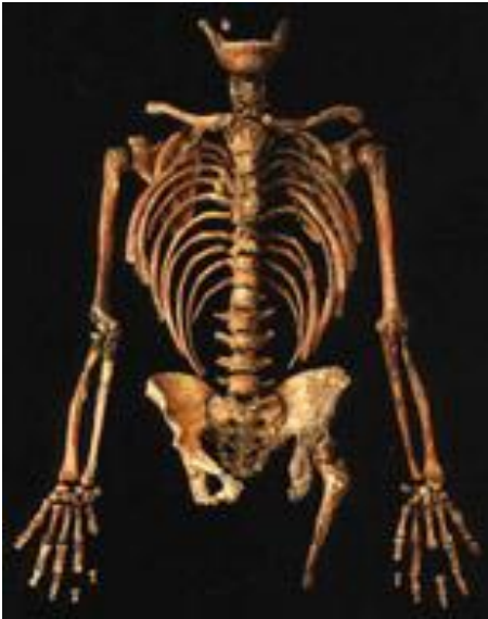
Скелет Кебара 2 из Израиля