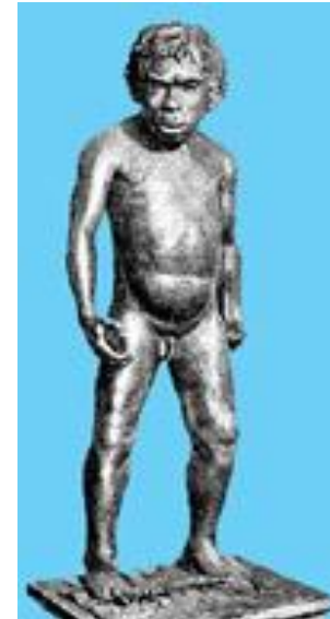
Реконструкция ребенка неандертальца из грота Тешик-Таш, выполненная М.М. Герасимовым