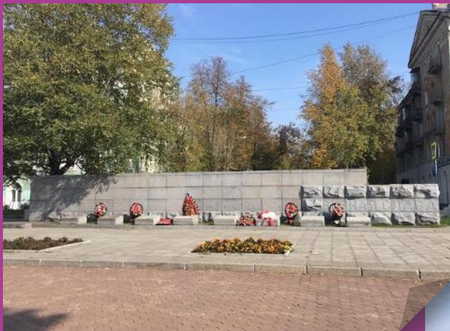
Памятник работникам Моторостроительного завода, погибшим в годы ВОВ.