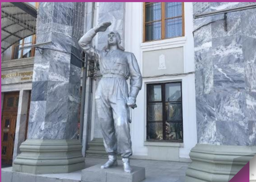
Скульптура летчика у входа в ДК Солдатов

В 1961 году Дворец был переименован в Дворец имени Я. М. Свердлова.