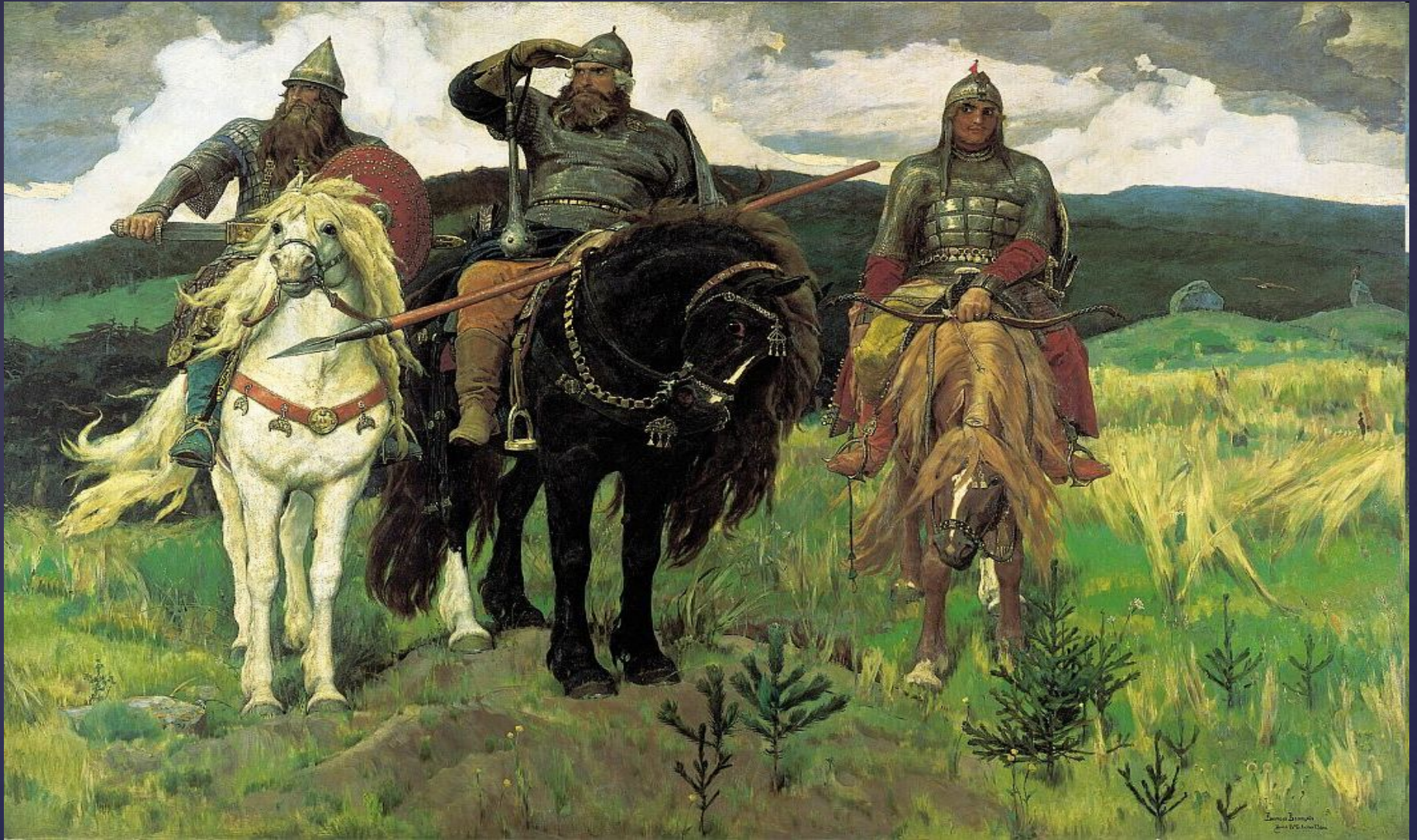
Три богатыря. 1881-1898