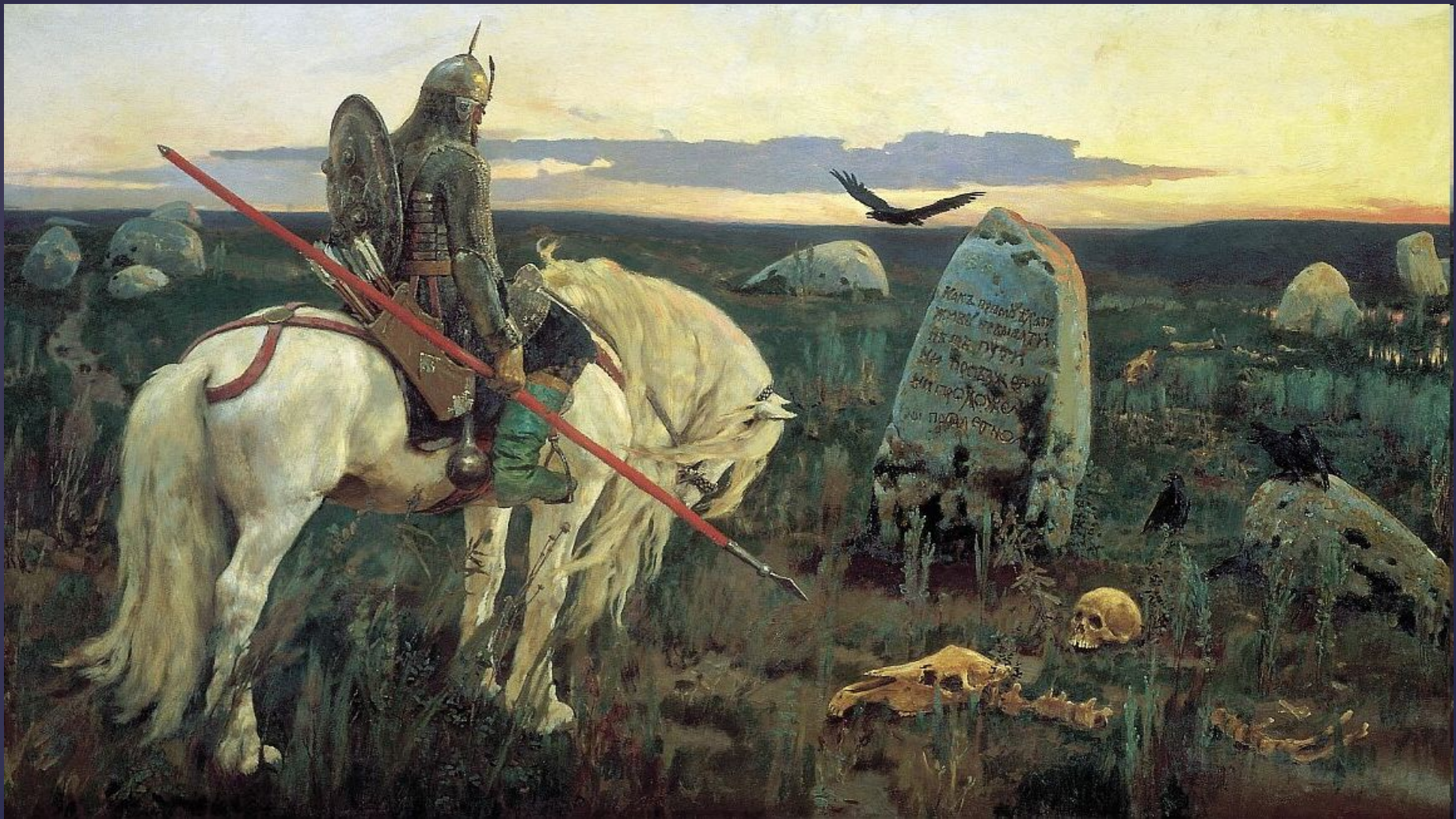
Витязь на распутье. 1882