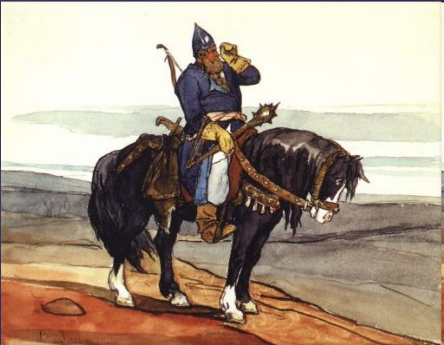
Витязь на коне. Богатырь. 1878.