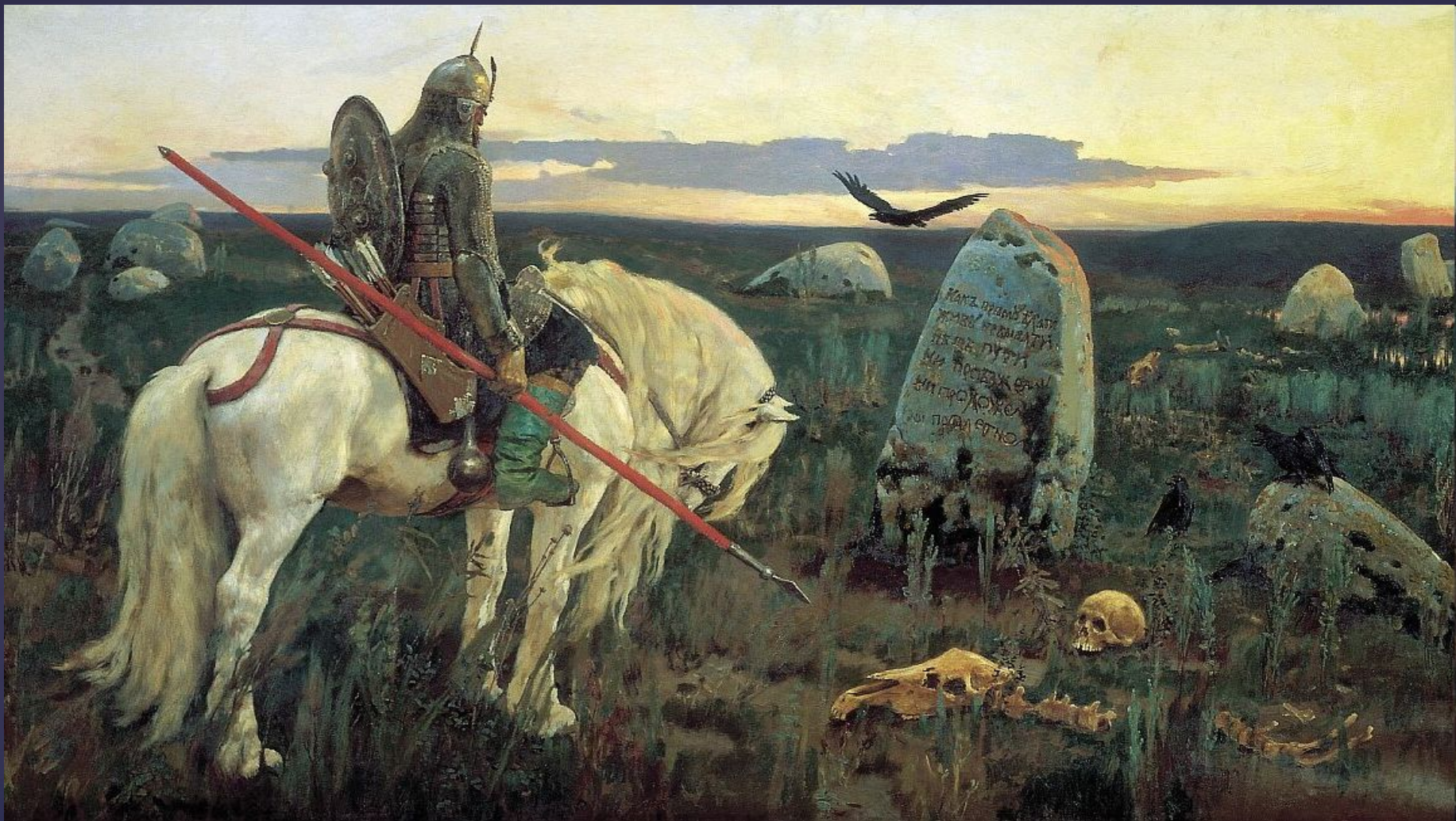
Витязь на распутье. 1882