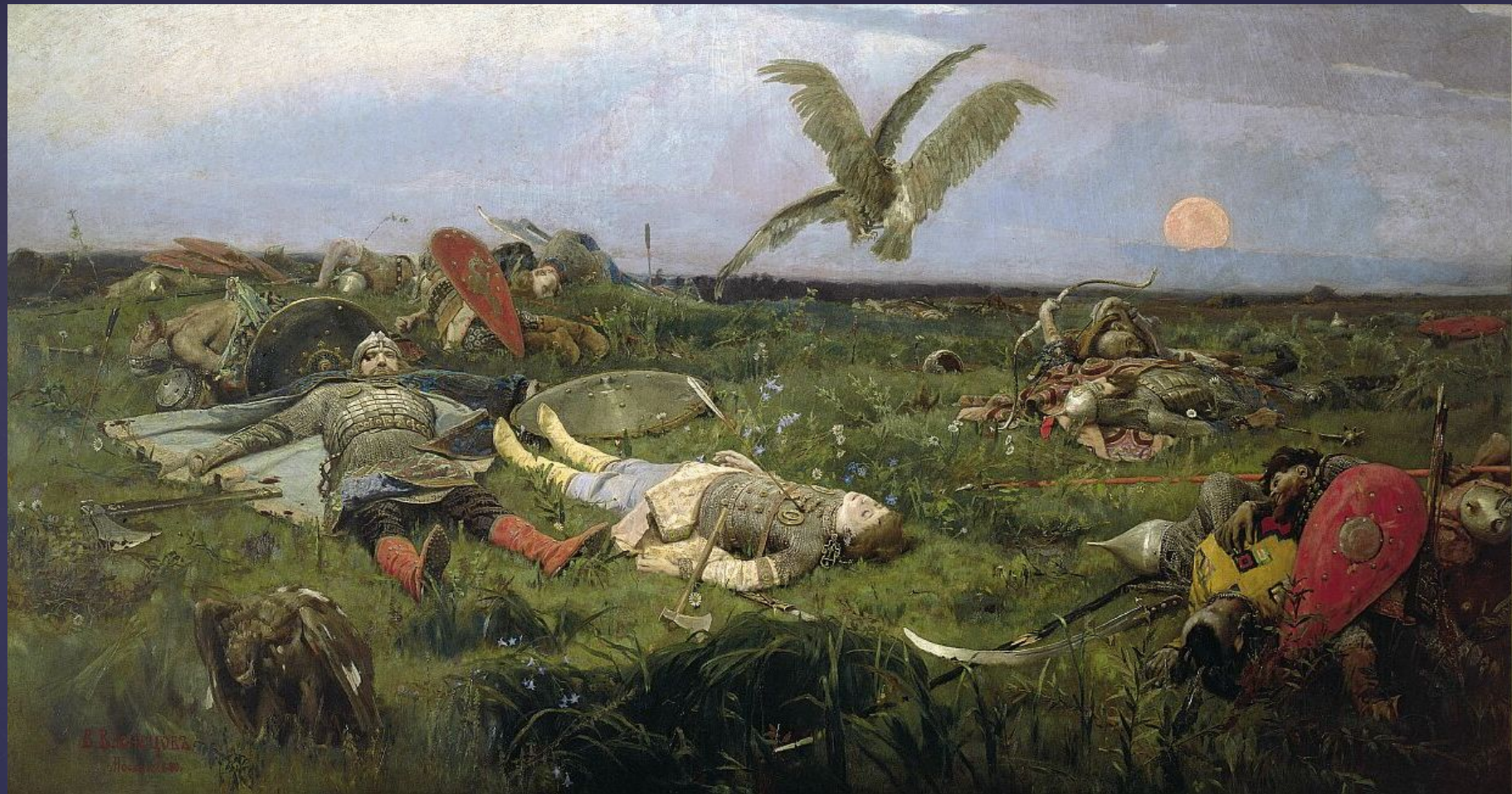
После побоища Игоря Святославича с половцами. 1880