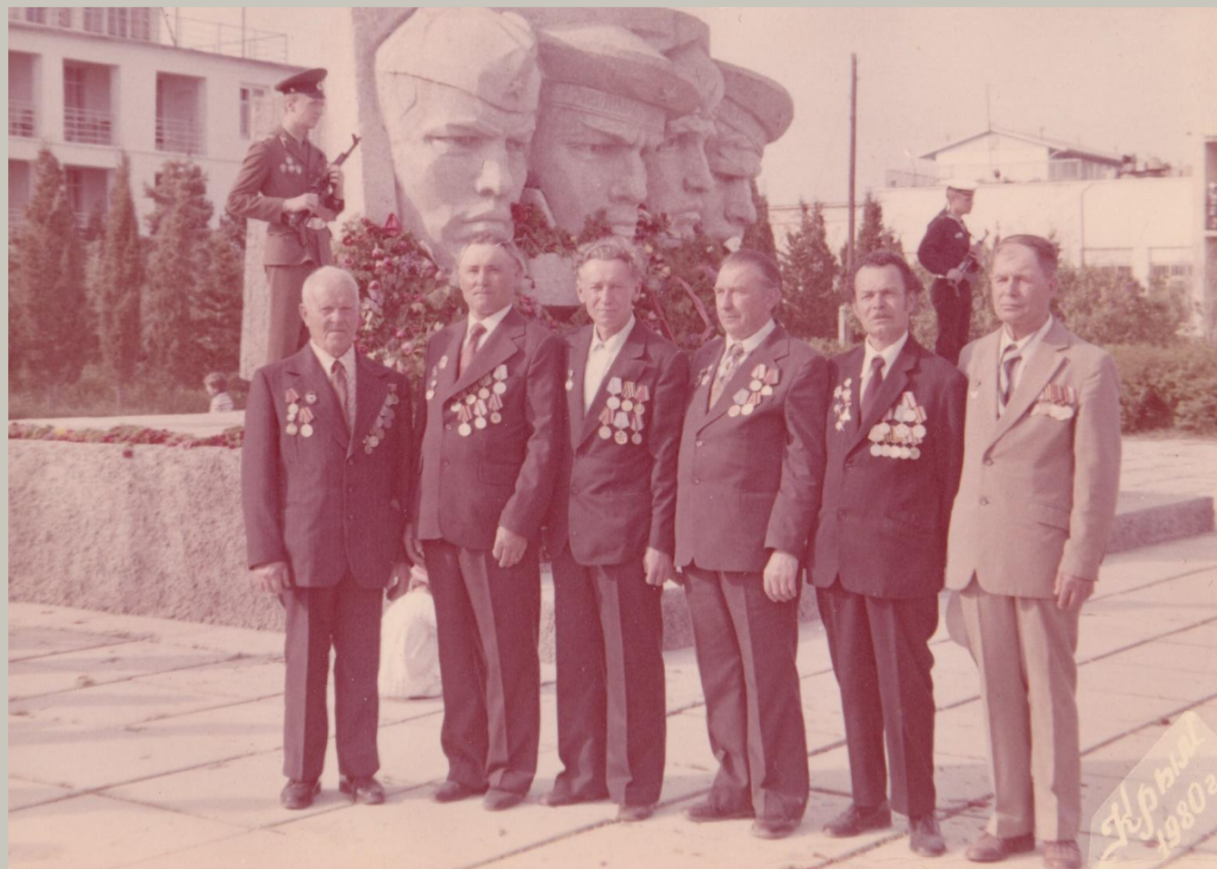
Ветераны Коктебеля 1974 год