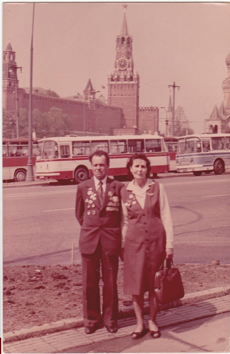
МОСКВА 1970-е годы