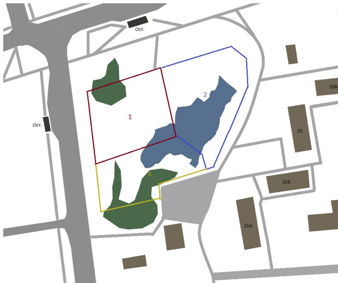
Схема сетки дорог