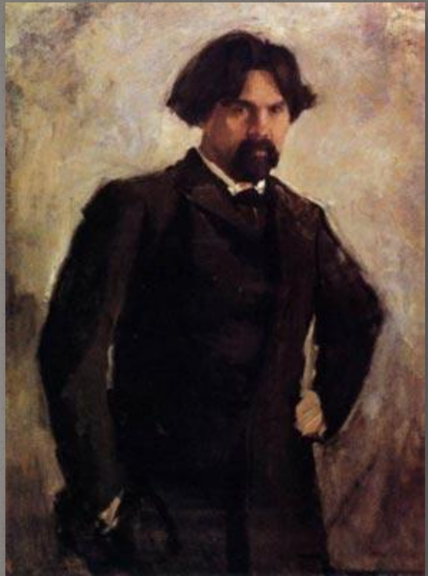
В.А Серов. Портрет художника Сурикова.

Суриков родился в 1848 году в Красноярске. Сильное стремление к обучению живописи заставило его сначала переехать в Санкт-Петербург, где в 1869-1875 годах он обучался в Петербургской Академии Художеств у знаменитого педагога Чистякова, который уже в те годы говорил о Сурикове, как о лучшем ученике школы. Начиная с 1877 года Суриков живет и работает в Москве, позже вступив в Товарищество Передвижных Художественных Выставок. Здесь, в Москве, Суриков создал свои наиболее значительные произведения - монументальные исторические картины "Утро стрелецкой казни" (1881), "Меншиков в Березове" (1883), "Боярыня Морозова" (1887).