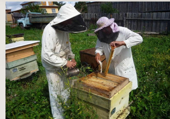
Сборка мёда 2 человека