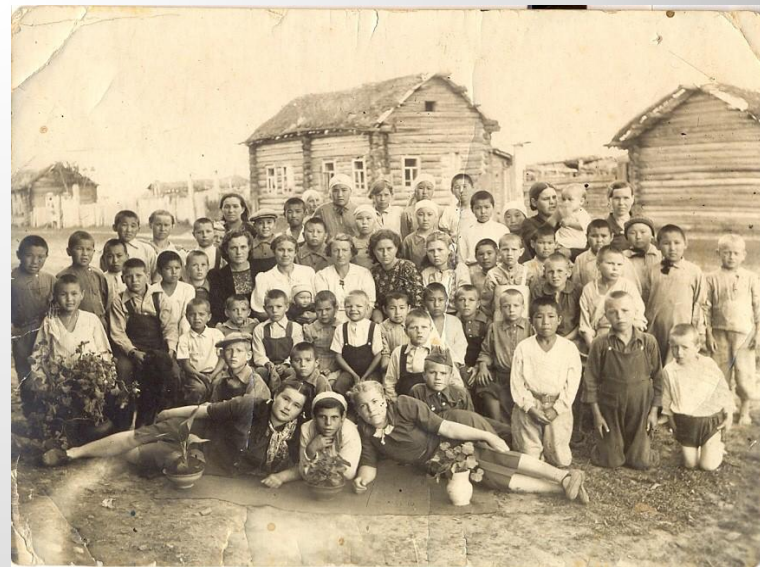
с. ЕМУРТЛА, 1936 год