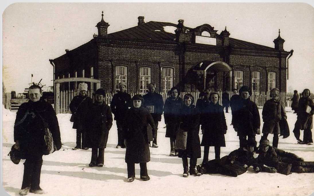
с. ЕМУРТЛА, 1941 год