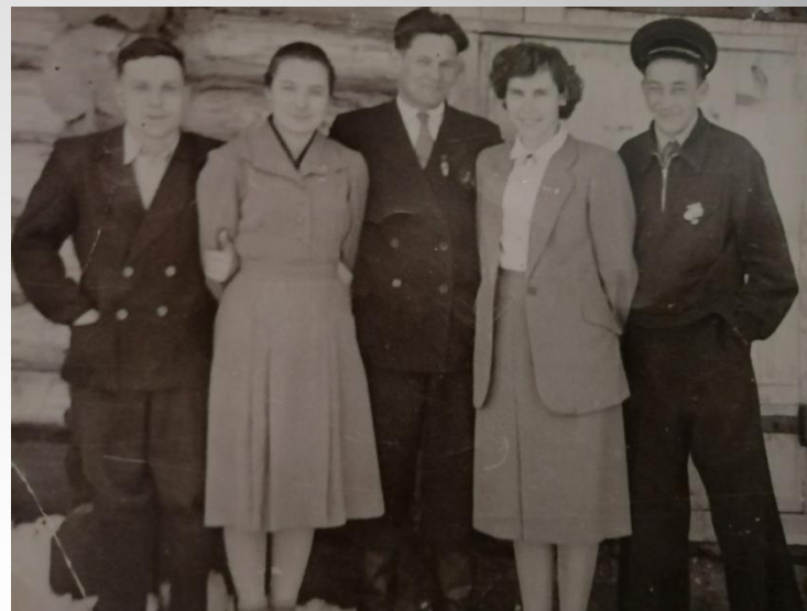
Начало 60-х годов