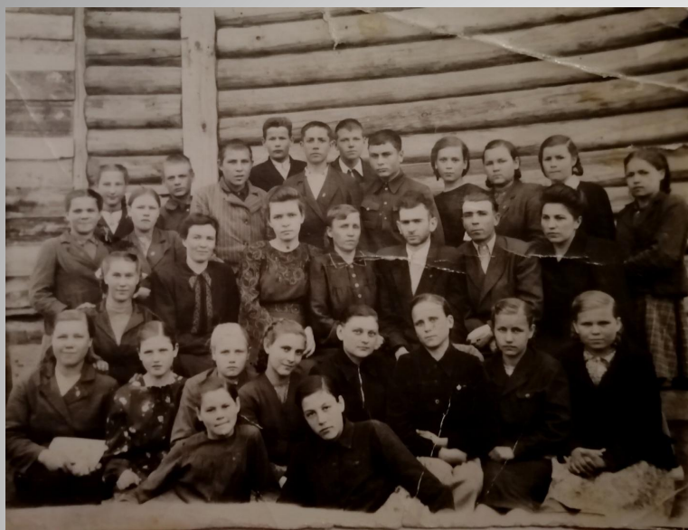
Школьные годы, конец сороковых