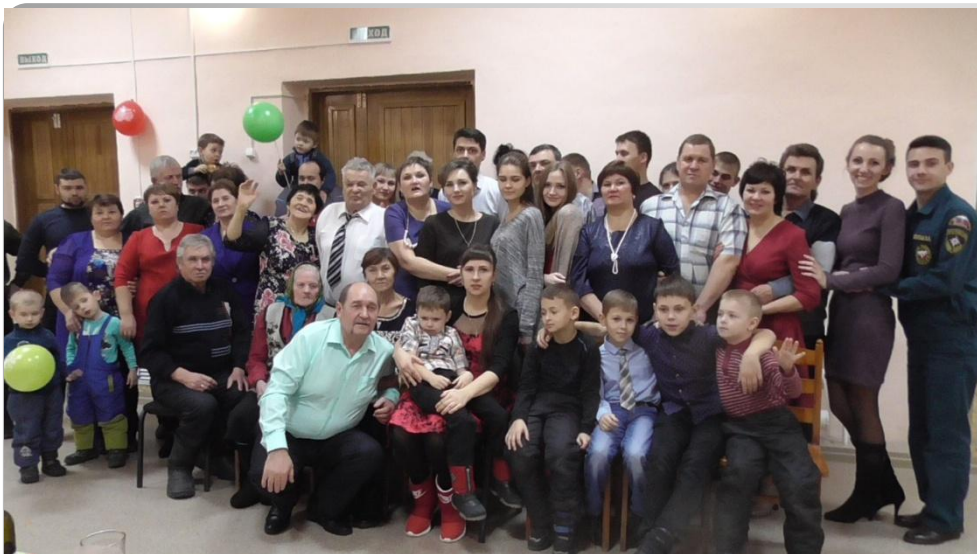
Большая семья Кривоногих