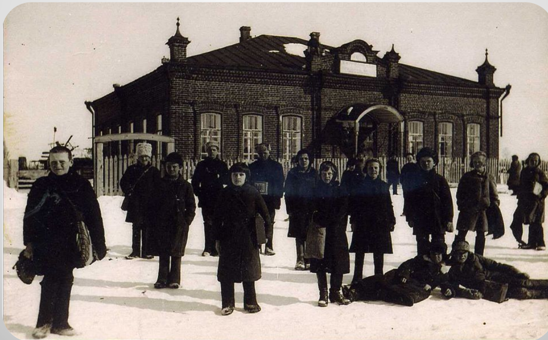
с. ЕМУРТЛА, 1941 год