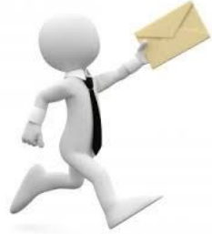
Погоня за партнёром