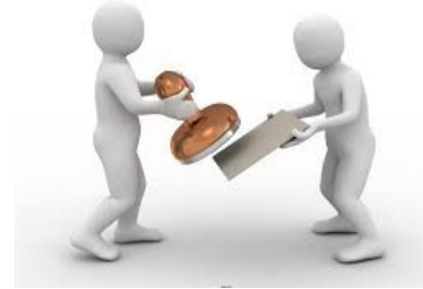
Проставлен и печатей