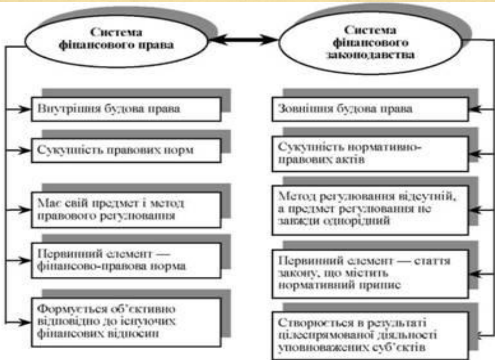
Рис. 2.1. Взаємозв'язок та відмінності між системою фінансового права і системою фінансового законодавства