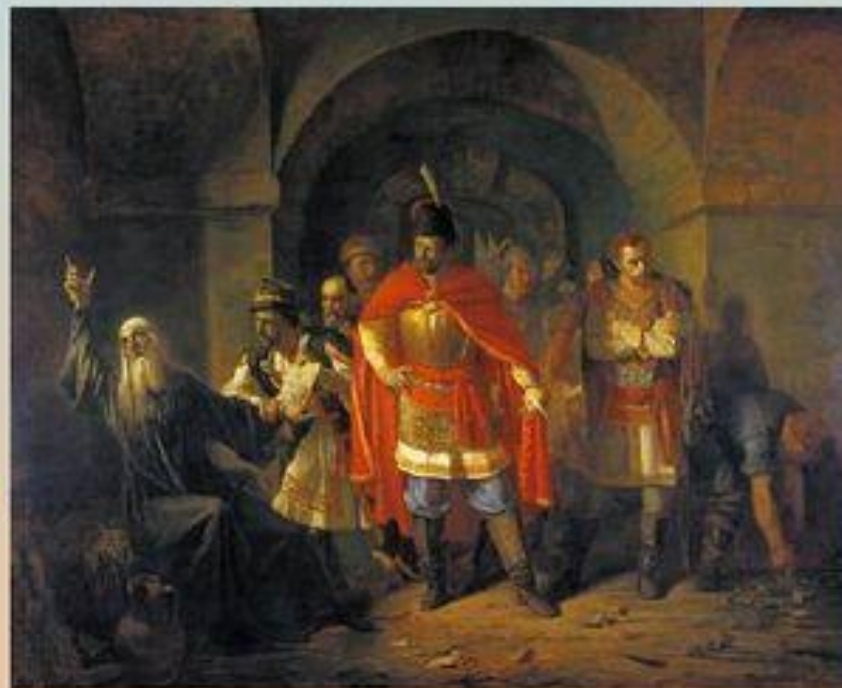
П.П.Чистяков . Патриарх Гермоген отказывает полякам подписать грамоту

Патриарх Гермоген – глава Русской православной церкви призвал российский народ к сопротивлению. За это поляки бросили его в темницу кремлёвского Чудова монастыря. Тем временем Лжедмитрий был убит.