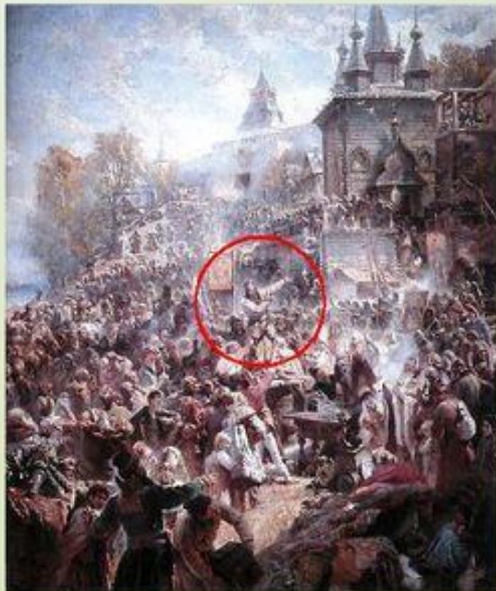
К.Е.Маковский. Воззвание Минина

Российское государство фактически распалось, став добычей иностранных захватчиков