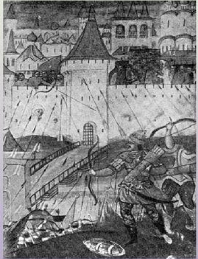
↑ Осада шведами Новгорода. 1611 г. (Деталь иконы XVII в.)