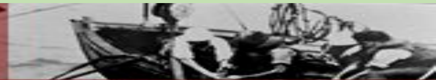
II. Конвенция об улучшении участи раненых, больных и лиц, потерпевших кораблекрушение, из состава вооруженных сил на море