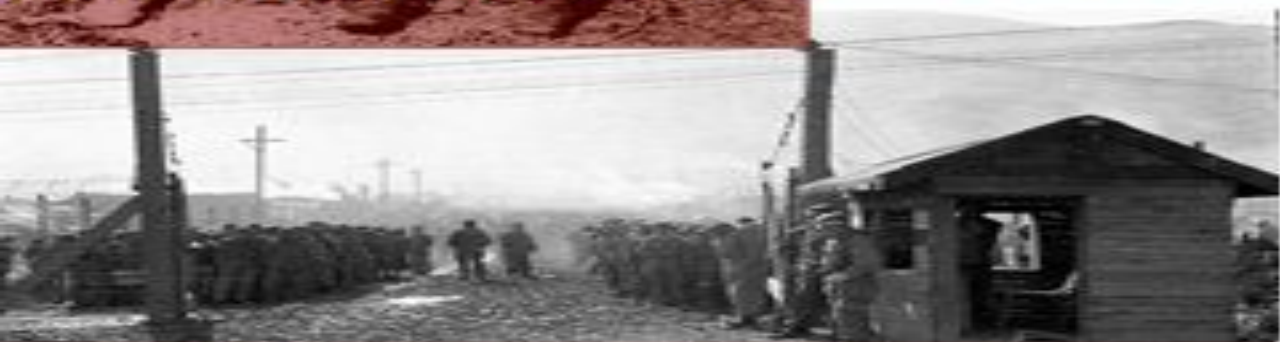
III. Конвенция об обращении с военнопленными