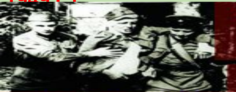
I. Конвенция об улучшении участи раненых и больных в действующих армиях

Об улучшении участи раненых и больных в действующих армиях; Об улучшении участи раненых, больных и лиц, потерпевших кораблекрушение, из состава вооруженных сил на море; Об обращении с военнопленными; О защите гражданского населения во время войны (приняты 12.08.1949 г.)