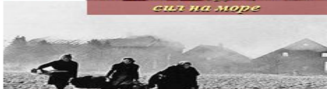
IV. Конвенция о защите гражданского населения