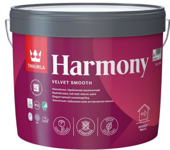
Элегантная глубокоматовая краска