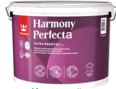
Износостойкая глубокоматовая краска