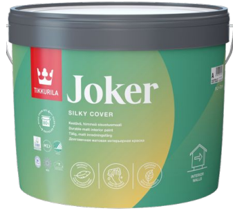
Долговечная матовая краска