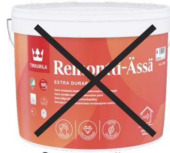
Экстрастойкая полуматовая краска