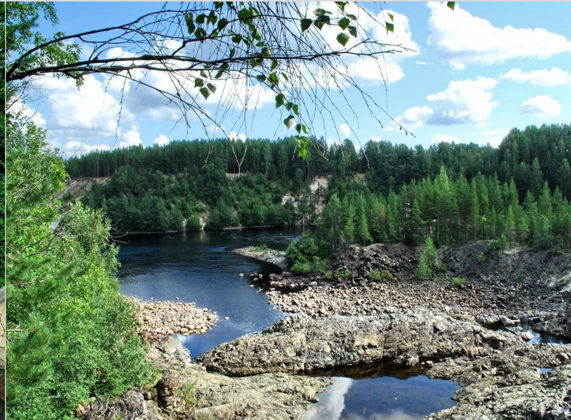
Марциальные воды в Карелии