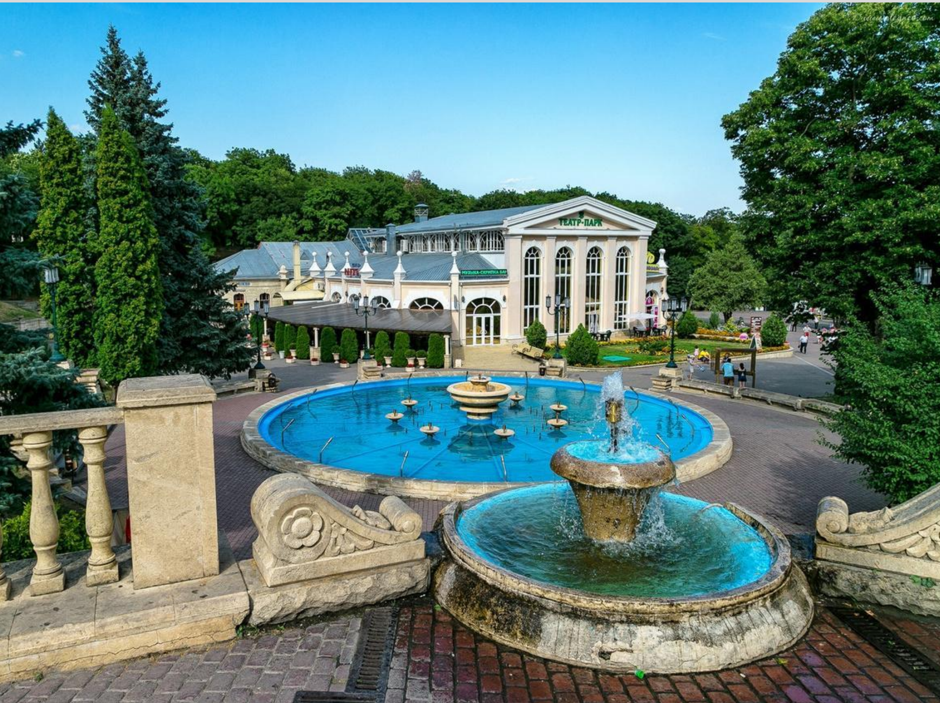
Кавказские Минеральные воды