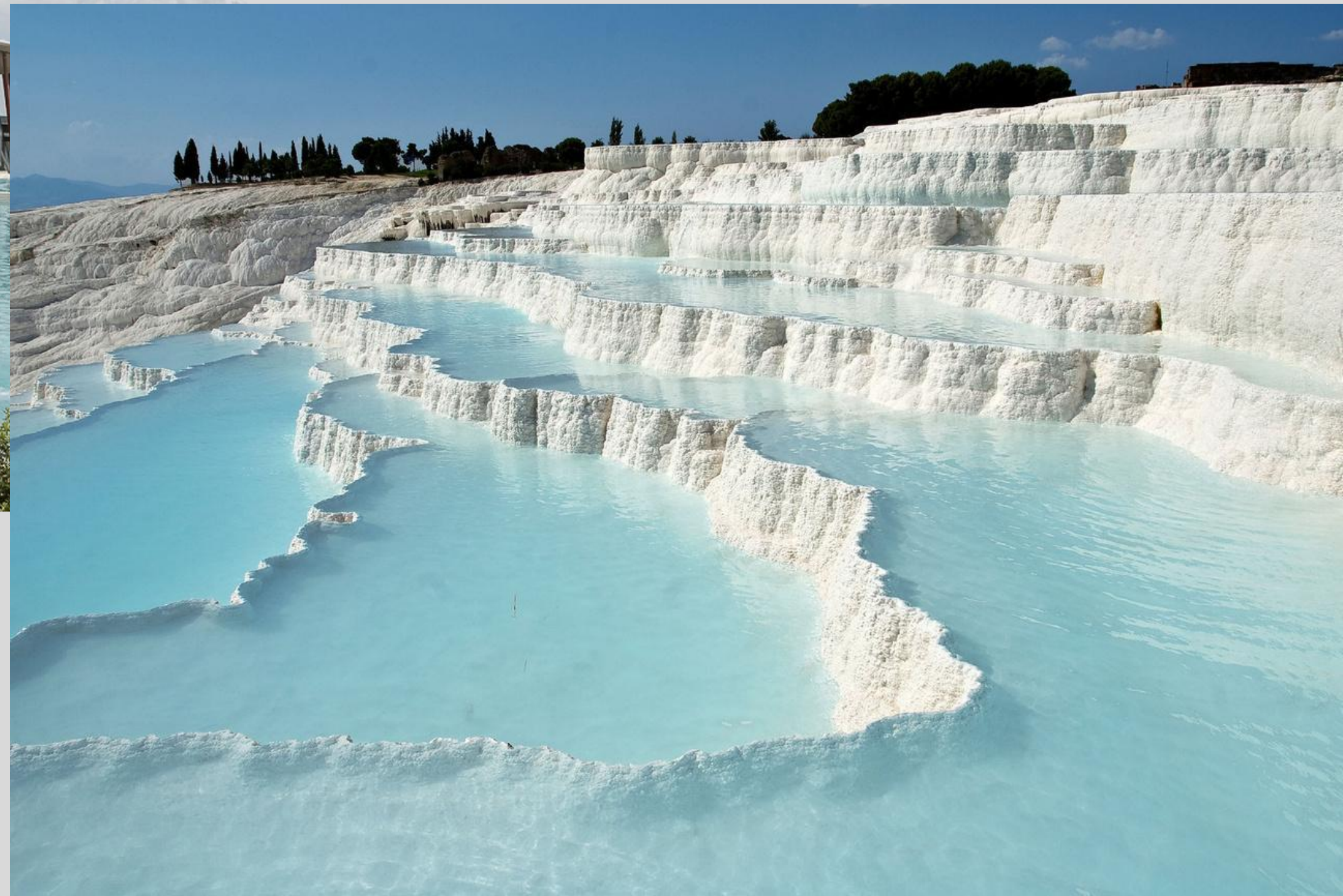
Кьянчано-Терме в Италии