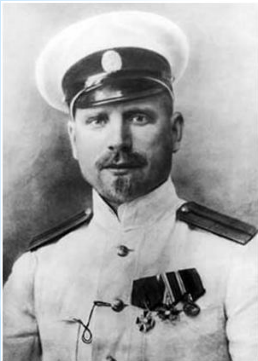
Георгий Яковлевич Седов ( 1877 — 1914 )

Георгий Яковлевич Седов — русский гидрограф , полярный исследователь, старший лейтенант. Организатор неудачной экспедиции к Северному полюсу [1] , во время которой умер, не достигнув заявленной цели, пройдя примерно 200 километров из необходимых 2000 [2] .