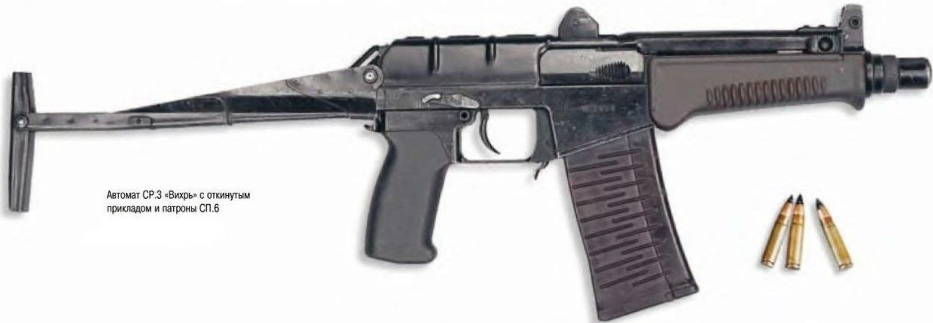
Автомат СР.3 «Вихрь» с откинутым прикладом и патроны СП.6