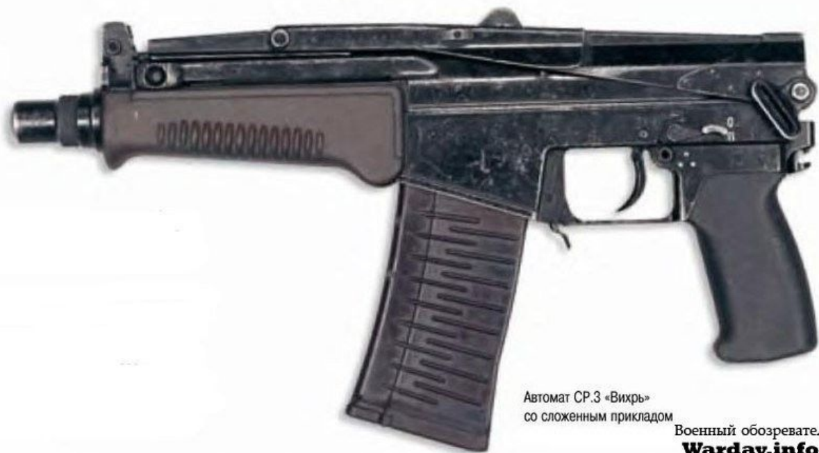
Автомат СР.3 «Вихрь» со сложенным прикладом