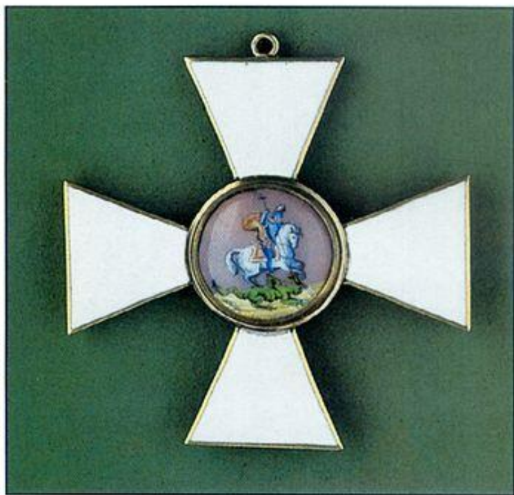
Знак ордена св. Георгия 3-й степени. Лицевая сторона. ВИМАИВС