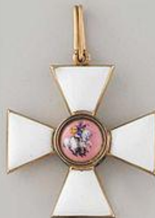
Знак 3-й степени