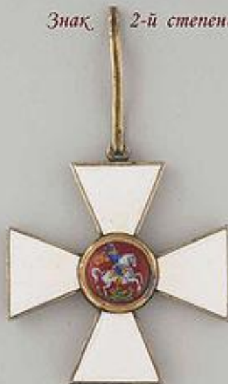
Знак 2-й степени