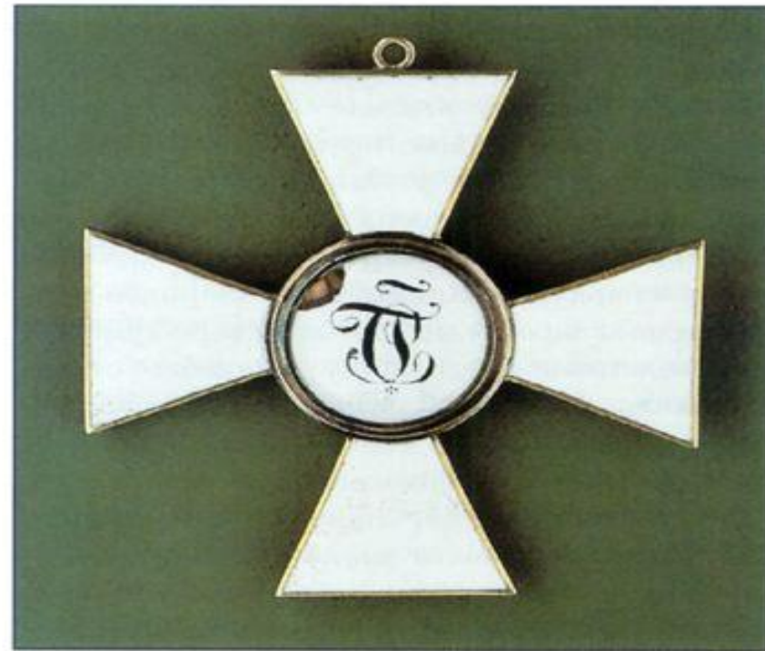
Знак ордена св. Георгия 3-й степени. Оборотная сторона. ВИМАИВС