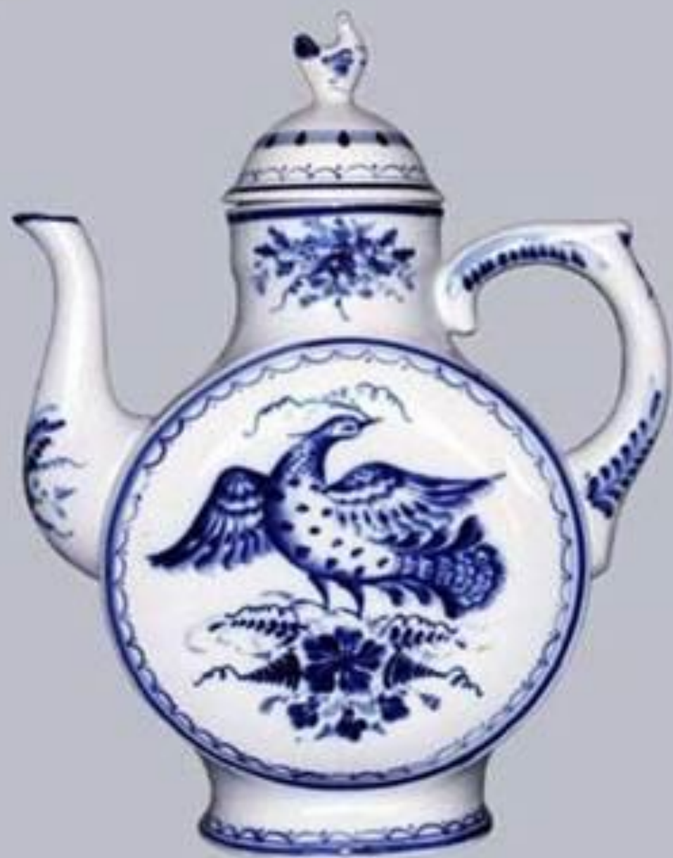
Роспись по керамике (Гжель)