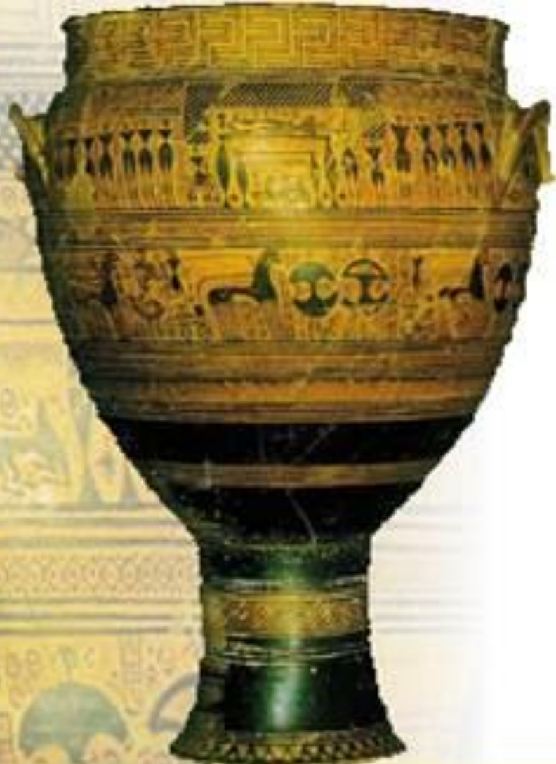
Дипилонский кратер. Греция