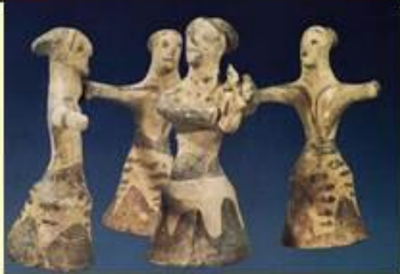
Глиняные фигурки играющего на лире и танцующих женщин. Греция