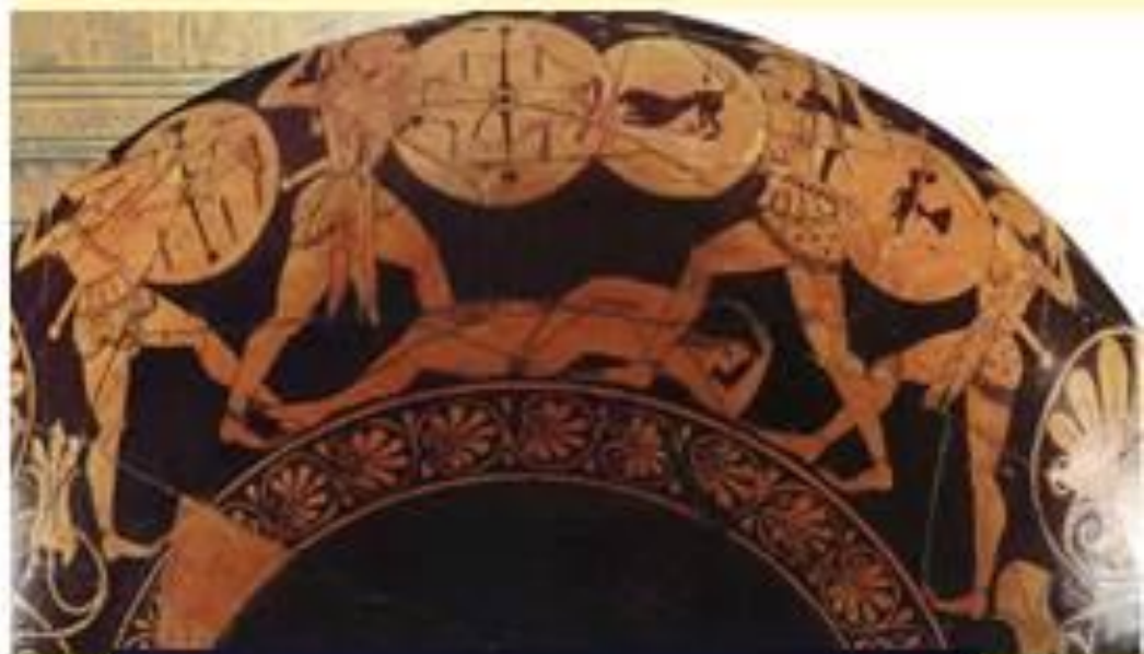
Фрагмент краснофигурной вазы. Греция