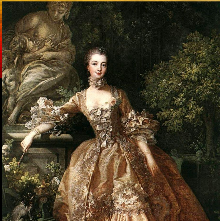
Молодая Екатерина 2