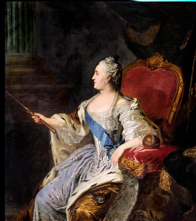
Уже в преклонном возрасте