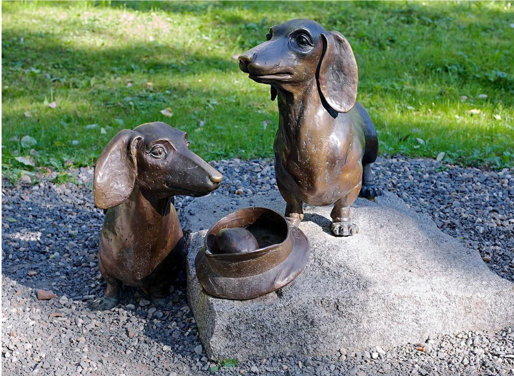
Памятник двум таксам